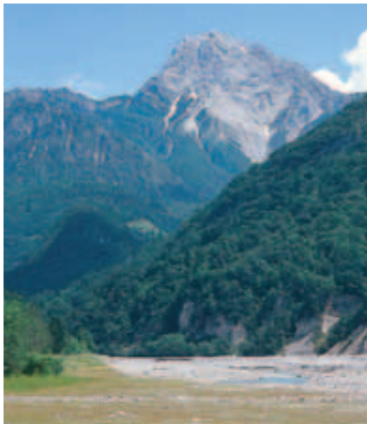
Sernio iz doline Incarojo

koliko izpostavljenega raza, ki mu sledimo kakih 100 m (mestoma II) skoraj do jugozahodnega grebena, kjer se svet položi. Tu spet naletimo na stezico, ki nas pelje v levo čez police in grape do severozahodne rame, na kateri stoji križ. Naša pot zavije desno vzdolž zračnega grebena do ozkega in razbitega vrha s kipecem Marije.