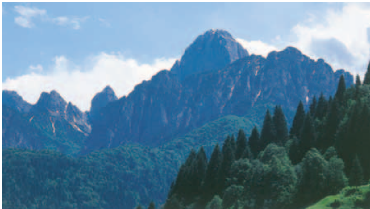
Sernio od severozahoda

vzpon na Grauzario sta leta 1893 opravila A. Ferruci in E. Pico z dvema domačinoma. Poleg vzpona na glavni vrh se v območju Grauzarie ponuja tudi velikopotezna, dolga in zelo zahtevna tura, zavarovana pot »A. Ferruci« in via ferrata »Cengle dal Bec«, ki obkrožita celoten masiv skozi krnico Gran Circo mimo bivaka Feruglio.