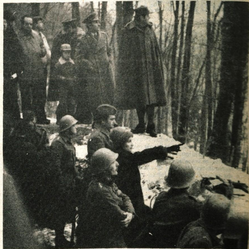
Gostje in predstavniki družbenopolitične skupnosti med ogledom vaje, ki je pokazala trdno vez med vojniki in občani