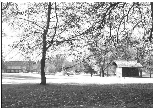
Čebelnjak na Brdu, v ozadju dvorec

Na JZ strani je vhod v čebelnjak, na SZ sta vgrajeni dve okni. Zgrajen je iz polbrun, streha z naprej pomaknjanim napuščem je krita s skodlami, žlebova sta lesena. Na izletni strani je pod panji pritrjena 26 cm široka naletna deska. Prostor pred čebelnjakom je tlakovan z betonskimi ploščami. Lesena skulptura pred čebelnjakom je delo Petra Jovanoviča. Masivna moška figura ponazarja figuralne panje, ki so običajno stali poleg čebelnjaka, čeprav za slovensko čebelarstvo niso značilni.