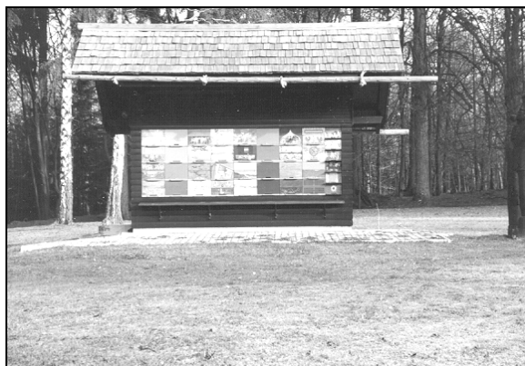
Pročelje čebelnjaka