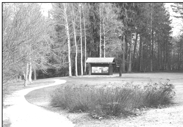
Čebelnjak s sprednje strani (foto: Ida Gnilšak, 2003)

Zelo temna barva čebelnjaka, ki je bil verjetno večkrat premazan z zaščitnimi sredstvi, je v neskladju s sivkasto barvo lesenega žleba, ki je naravno patiniral, oziroma ni znakov, da bi ga zaščitili s premazom. S čebelarškega vidika je popolnoma neustrezna betonska plošča pod čebelnjakom, ki lahko povzroča preveliko vlago v notranjosti. Pravilno grajen čebelnjak je nekoliko dvignjen od tal, da pod zgradbo lahko kroži zrak, ki predstavlja nekakšno toplotno blazino.