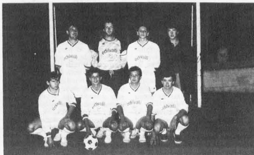
Ekipa od Edilvalli iz Cemurja

Rezultati ponedeljka: Apicoltura Cantoni - Bar al Ponticello 6-2; GDU Ponteacco B - Gubane Dorbolo 4-8. Od torka pa: Mersino - Interclub 2-15; Clenia - Saccavini srl 4-14.