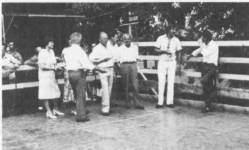
Ena skupina odraslih, ki igra na skarlanje

Tel obliški praznik je zaries niekej posebnega, narlieus od naših sejmu, čeglih je narbuj mlad, saj so ga parvič organizal lan. Pa kaj ima vič ko te drugi? Parvo riec, ki jo je treba reč je, de za ga organizat an pejat naprije sodeluje an pomaga vsa vas. Ze tuole je vriedno spoštovanj, saj na žalost ni vič dost takih vasi, kjer bi biu še takuo žiu, čut skupnosti.