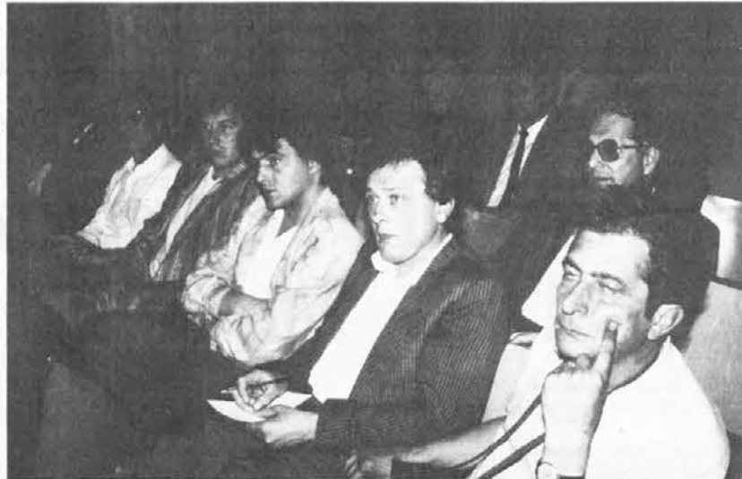
Posveta se je udeležilo veliko število ljudi in krajevnih upraviteljev

Per quanto riguarda la tutela delle minoranze, che Bertoli distingue tra quelle linguistiche e quelle nazionali (francesi, tedeschi e sloveni del FVG), la strada da percorrere è quella della Costituzione, applicando i due principi fondamentali di uguaglianza e libertà. Per quanto riguarda la tutela degli sloveni, ha detto il parlamentare democristiano, va tenuto conto della ricca varietà dialettale