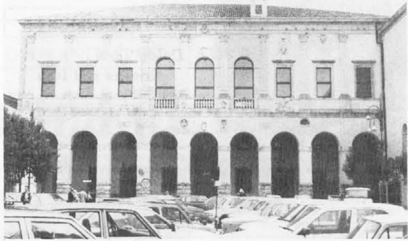
Il palazzo del Procuratore Veneziano dove, ultimati i lavori di restauro, avrà sede il museo di Cividale