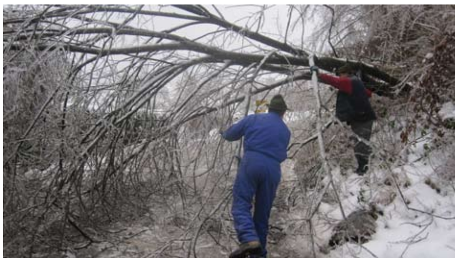
Avbelj Franci s.p. na cesti Negastrn

bili zelo potrpežljivi, čeprav so bile težave zaradi izpada elektrike najbrž marsikje velike, povezane z gretjem, s telefonskim mrkom in čeprav ceste v vsakem momentu niso bile prevozne. Prva elektrika je posvetila po 24 urah in postopoma prišla do vseh krajev. V vmesnem času so bili dostavljeni v uporabo agregati, ki so jih gasilci in sami občani vozili med domačijami. Dva dni ni bilo pouka na naših osnovnih šolah.