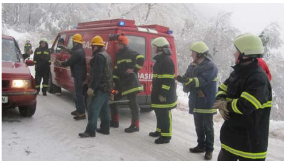
Poročanje, kako je v Veliki vasi

čez noč, praktično nepretrgoma. Dostikrat so bila podrtá drevesa že odstranjena in veselje veliko, pa so se drevesa zopet podrla in vse je bilo potrebno začeti znova kljub utrujenosti, mrazu in žledu. Za hip bi se lahko pojavil celo občutek nemoči pred naravo. Toda družno, z veliko volje in zavestjo, da je pri pomoči vsak del reševalne verige, ki se ne sme prekiniti, je bila v večji meri po petih dneh občina uspešno rešena. Zadnji dan so združeno gasilci na roke potegnili električni kabel ob cesti na Mohor. Tudi tu se je zaslíšal prešeren vrisk domačinov, ki so razumeli izreden napor rešiteljev - gasilcev ob pomoči delavcev Elektra. Kot zadnje dejanje napornih dni so v soboto zapele motorne žage Negastrnčanov, ki so razbremenili pot in električne kable na lukoviško stran, da so lahko izklopili zadnji na moravškem potreben agregat.