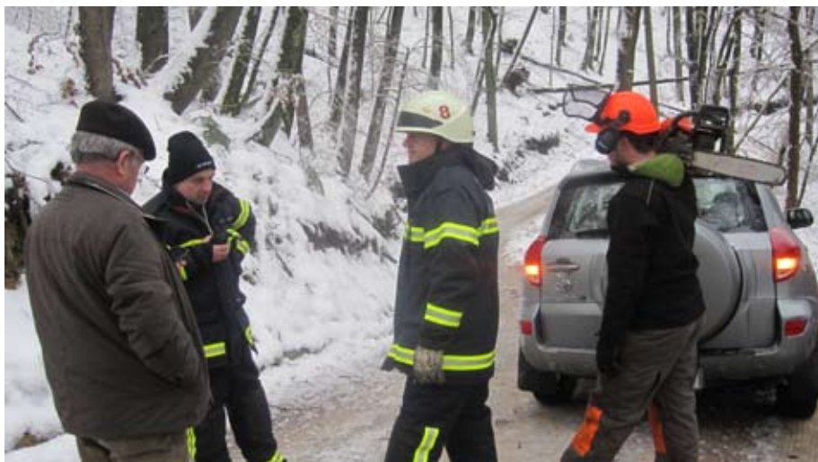
Usklajevanje kje, kdaj, kako

Do sedaj smo v naši občini ob naravnih ujmah po Sloveniji lahko rekli: Imamo pa srečo, da naših krajev ni tako hudo zajelo kot druge. Večkrat je šlo tudi mimo nas. Tokrat ne! Toda že v prvih urah se je vodstvo organizacij povežalo, izdalo ustrezna povelja, tudi občani so pomagali. Ni se čutila nestrpnost, nasprotno, ljudje so