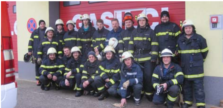
Gasilci PGD Moravče, Krašče in Vrhpolje, ki so se javili na poziv za vlečenje električnega kabla na Mohor pred akcijo.