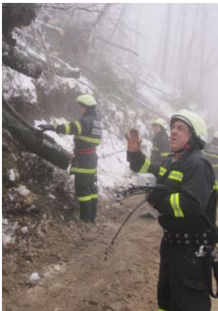
Zadnja akcija na cesti za napeljavo elektrike na Mohor, več daljnovodov je bilo podrlih

Prvi dnevi v februarju smo imeli gasilci polne roke dela. Naravni pojav, ko se dežne kapljice primejo na veje dreves in zmrznejo se imenuje žled. Ko pa pade še nekaj takšnega dežja pa veje ne zdržijo obremenitve. Tako se začnejo lomiti veje, ter cela drevesa. V pobočjih pa se drevesa izrujejo. Tako smo gasilci cele GZ Moravče sodelovali pri čiščenju dreves in vej iz cest po celi naši občini. Na nedeljo popoldne je poveljnik zveze aktiviral vsa društva v občini za pomoč. Tako smo v petih dneh imeli 185 intervencij predvsem odstranjevanja dreves. Vsak dan je bilo na delu od 30 do 50 gasilcev. Največ dela smo imeli z žaganjem dreves na cestah, pomoči z agregati ter prevozi vode. Ker pa ima vsako društvo eno žago so člani prinesli svoje žage in opremo. Najbolj je bilo prizadeto