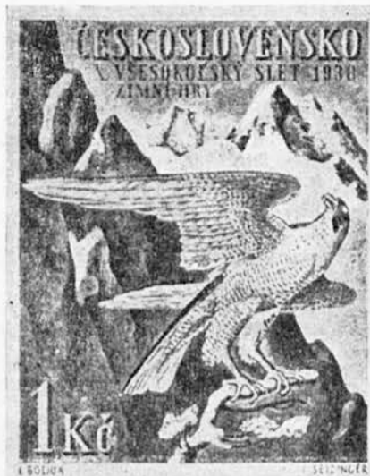
Sletska poštanska marka za zimске igre

niku, na Beskidima, u Koritnici i u Karpatima. Teren gde će se ova takmičenja održati, izabraće zastupnici COS u spozumu sa organizatorima IV srednjoškolskih igara. Isto tako biće sporazumno određen i program takmičenja. Premda će u nekim disciplinama nastupiti naraštaji zajedno sa srednjoškolicima, klasifikacija biće ipak zasebna.