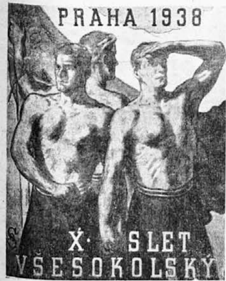
Sletski plakat (rad br. Karela Minarža)