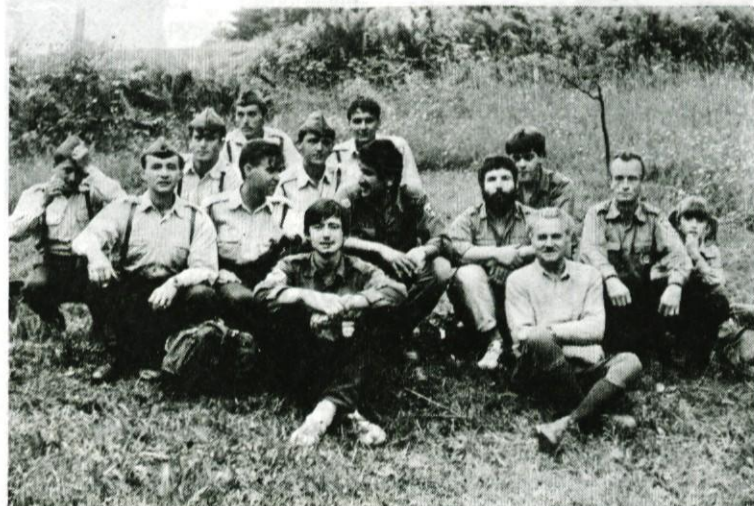
Mladina in vojaki se srečujejo na pohodih