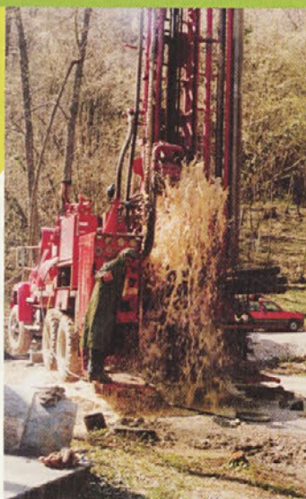
"Voda iz nove vrtine je privrela iz globine."

Rojstvo sedanjega mirskega vodovoda sega v leto 1968. Tedaj je bilo zgrajeno zajetje, ki je zagotavljalo kvalitetno pitno vodo celo do 35 litrov na sekundo. Upravljanje vodovoda na Mimi je vseskozi v rokah Dane, ki je strokovno usposobljena za distribucijo pitne vode in je hkrati tudi največji porabnik, ves čas pa si prizadeva za visoko