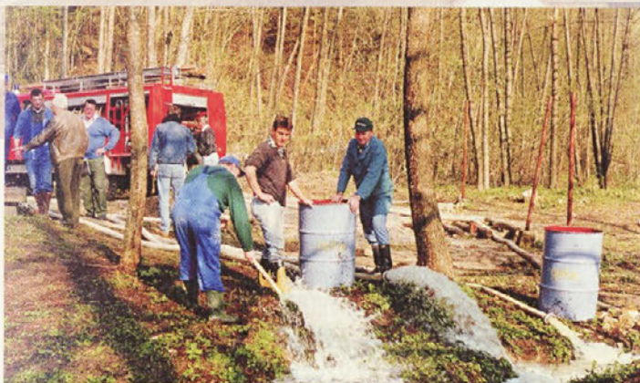
"Mirnski in mokronoški gasilci pri črpalnem poizkusu na novi vrtini."

Ker z vrtno garnituro do mesta vrtanja po gozdni kolovozni poti ni bilo možno priti, je Občina zagotovila finančna sredstva za izgradnjo dostopne ceste, katere stroški so presegli milijon tolarjev. Izvajalci so izvrtali dve vrtini: prvo z globino 70 in druga z globino 40 metrov. Zgornji del vrtine so zacevili s cevmi fi 219 mm, da bi preprečili zunanje vplive na vodo v vrtini. V črpalni poizkus so se aktivno vključili neutrudni in