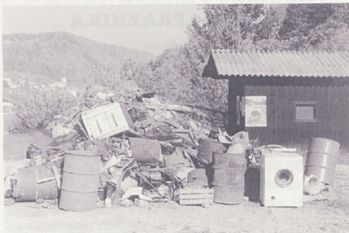
kup kosovnih odpadkov v Zapužah