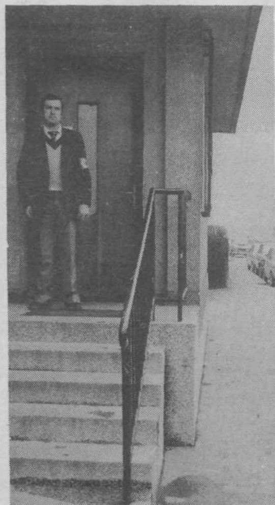
Narodna zaščita je zavarovala vse pomembne objekte