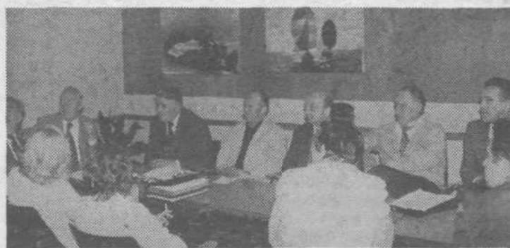
10.15 Izredna seja odbora za ljudsko obrambo in družbeno samozaščito v TEOLU