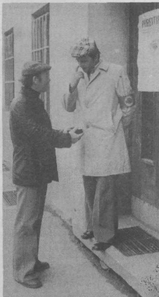
Pripadniki Narodne zaščite opravljajo nadzor... pred vhodom v stavbo KS Moste