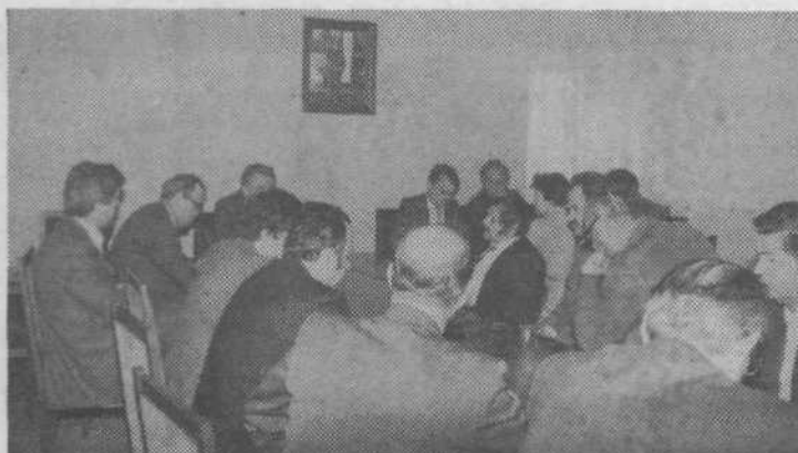
Ura je 10.15. Svet za ljudsko obrambo, varnost in družbeno samozaščito se je sestel na izredni seji. Predsednik sveta je prebral ukaz o pričetku občinske vaje Pugled '79 in seznanil člane z nastalimi razmerami. Svet je sprejel ukrepe in pričel z njih izvajanjem.