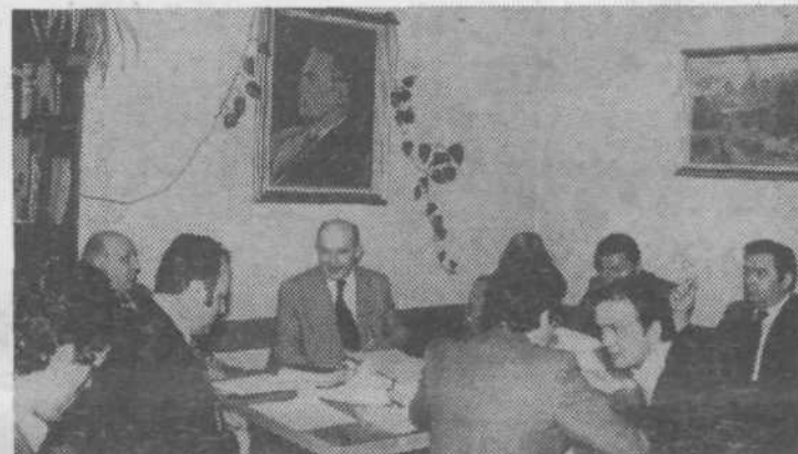
Ura je 12.00. Izvršni odbor predsedstva OK SZDL ugotavlja: Vaja poteka po predvidenem načrtu, ki zahteva polno angažiranje vseh družbenopolitičnih organizacij, njih usklajeno delovanje in povezovanje tako s terenskimi organizacijami kot z onimi v tozdih. Pokazala se je potreba po vsebinskem ažuriranju načrtov in pravočasni razporeditvi kadrov