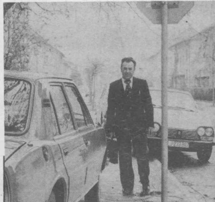
Kurirji že prenašajo dodatne ukaze