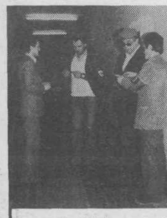
... na hodnikih v stavbi skupščine; tudi novinarji niso izjeme!