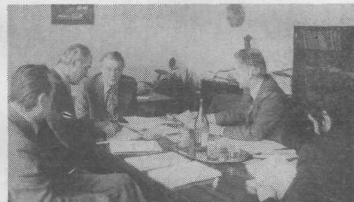
Vodstvo vaje ima polne roke dela