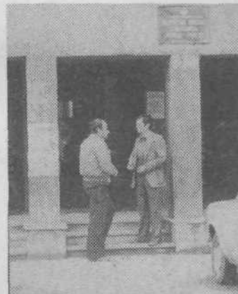
... pred stavko občinske skupščine