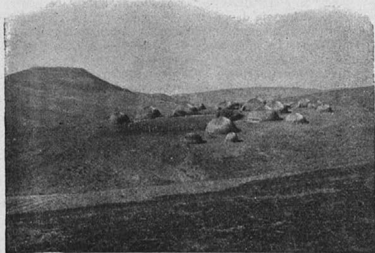
Mislil bi si kdo, da so to kupi posušenega sena Ne. — To so kočice mojih bednih zamorcev.

»Vse, kar je bilo rečeno, je popolnoma res in utemeljeno. Nič niste pretiravali. Vendar se mi zdi primerno, da vam povem neki dogodek, preden glasujemo, dasi nisem bil naprošen za to.«