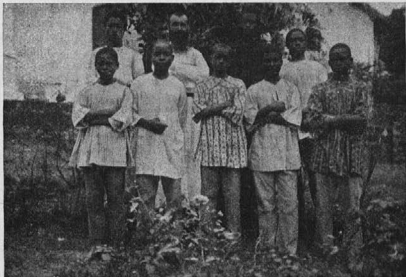
Misijonar z zamorskimi fanti, ki želijo postati duhovniki.