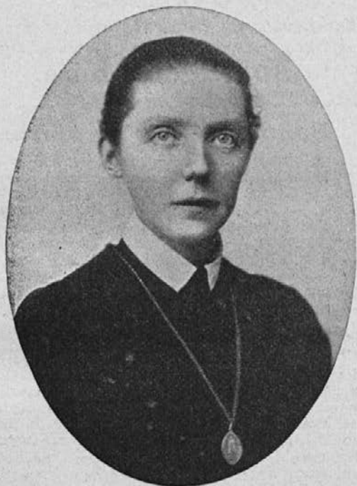
Služabnica božja Marija Terezija Ledóchowska