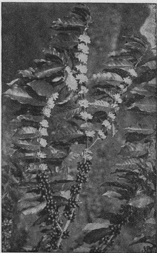
Cretoča vejica kavnega drevesa