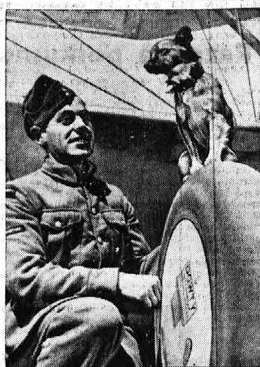
Zvesti letalski sopotnik, ki se v zraku prav dobro počuti

krat. Skoraj enak prirastek bo na azijskem otočju. Slovani se bodo pomnožili od 278 na 624 milijonov, Amerikanci od 263 na 593, romanški in germanski narodi skupaj od 297 na 315 milijonov, Japonci sami od 100 na 263 milijonov, Angležev pa bo v Evropi približno ravno toliko kot zdaj, še nekoliko manj. Omenjeni strokovnjak prihaja do zaključka, da bo število prebivalstva, ki se je od 17. stoletja do danes povečalo od 500 milijonov na na dobri 2 milijardi, naraslo do leta 2000 že na 4.75 milijard. Razlaga takole: Ker je vedno večji tehnični napredek, je tudi proizvodnja zelo narasla, sorazmerno bolj kot pa število ljudi na zemlji. Danes ima vsak posameznik na razpolago več proizvodov in življenjskih potrebščin, kot jih je pa imel pred tremi stoletji. Tehnični napredek pa še nikakor ni dosegel svojega vrha in se bo prav gotovo še izpolnil. Človeku bo postala dostopna tudi ona zemlja, ki je bila dozdaj bodisi nedosegljiva ali pa toliko prosta, da je bilo življenje na njej nemogoče. Človek bo imel več sveta, zemlja pa bo zaradi boljše obdelave več dajala. V vedno večji meri bo človek zemljo umetno namakal in gnojil. Vedno bolj bo tudi gojil razne plodonojne rastline, od katerih bo lažje živel kot danes. Ne more biti dvoma, pravi tisti severnjaški strokovnjak, ki se bavi s temi vprašanji, da ne bi mogla zemlja leta 2000 preživeti 4.75 milijard ljudi. Celotno določilo boljše jih bo lahko preživela tedaj 4.75 milijard, kot pa danes le dobri 2 milijardi.