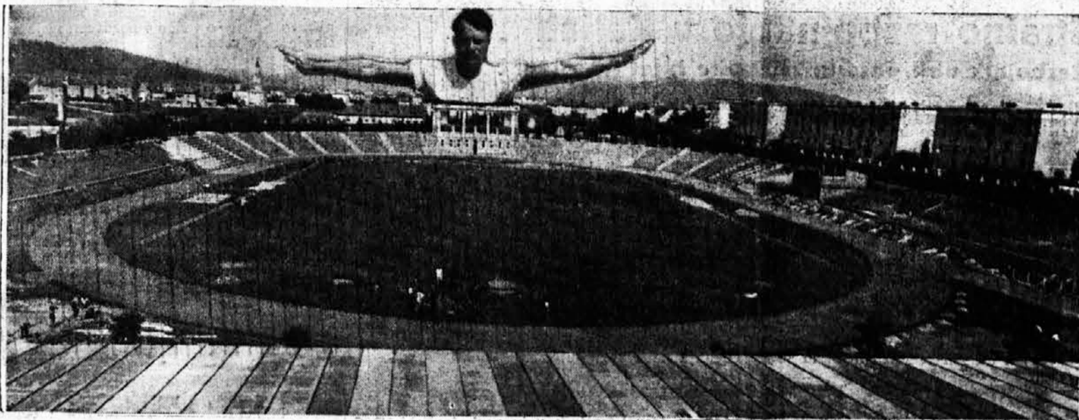
Naš Stadion — naš ponos!

Bog živi našo domovino in njeno mladino! Bog živi naše prijatelje iz vse Evrope! Bog živi še zlasti naše slovanske brate!