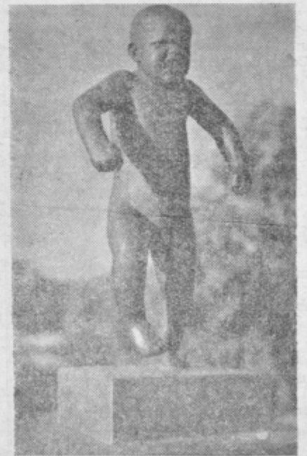
Kaj se ne bo zgodilo tako, kakor želimo?

jemo še preden pridemo v park. Vhodna vrata in dve kočici ob strani sta posejani z motivi reliefa o borbi človeka s samim seboj. Pred leti je bil