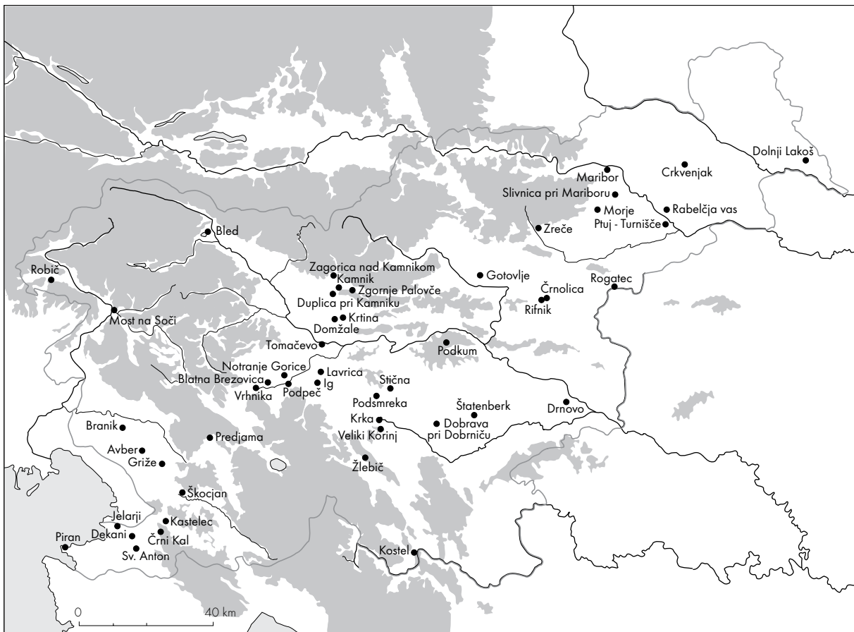
Abb. 1: Die bronzezeitlichen Fundorten in Slowenien. Sl. 1: Bronastodobna najdišča v Sloveniji.

steiermark (Schmid 1909; ders. 1925). Die beiden folgenden Abrisse stammen von S. Pahič, der die Problematik in zwei Kapitel geteilt hat, so daß er zunächst die Bronzezeit und danach die Zeit der Urnenfelderkultur vorgestellt hat (Pahič 1975).