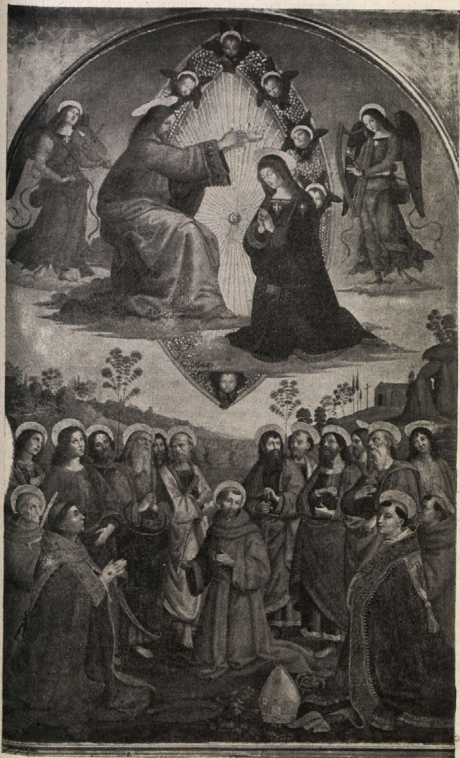
Marijino kronanje. Pinturicchio Bernardino (1454—1513).