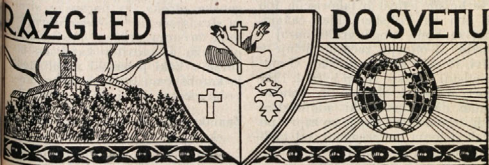
Slika »Marijinega vnebovzetja«.

Pri tistih molitvah, pri katerih je predpisano, da se imajo kleče opraviti, je treba pač ta pogoj izpolniti. Seveda je samo po sebi razumljivo, da taki ljudje, ki vsled starosti, bolezni itd. težko kleče, lahko opravijo te molitve tudi sede ali leže v postelji. Prav tisto velja, če kdo na pol kleči in napol sedi, ker so klopi mnogokrat tako narejene, da je težko drugače mogoče. Telo mora molitev pospeševati, ne pa ovirati.