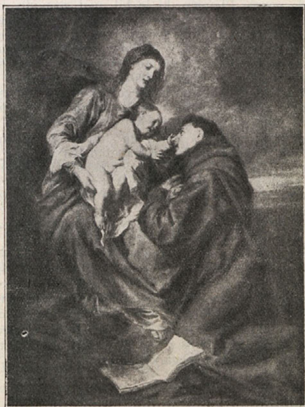
Sv. Anton v molitvi pred Materjo božjo, ki je sedež modrosti.