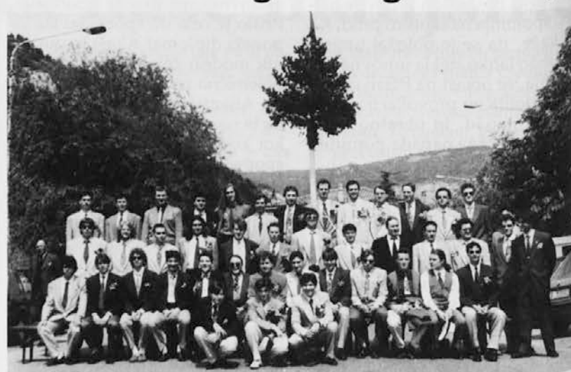
Mladi z Brega so za domače običaje vedno bolj navdušeni

Začetek maja je velik praznik mladine in vseh vaščanov iz Doline in Brega — Prebenega, Boljunca, Boršta in Ricmanj, ki so ponovno podoživeli čar starodavnih običajev s postavljanjem majev. Zadnja leta vedno bolj prevladuje občutek skupnosti. Prišlo je v navado, da se mladi iz vseh vasi srečujejo med seboj. Nekoč je bilo drugače, saj je včasih med pripadniki raznih vasi prišlo celo do sporov.