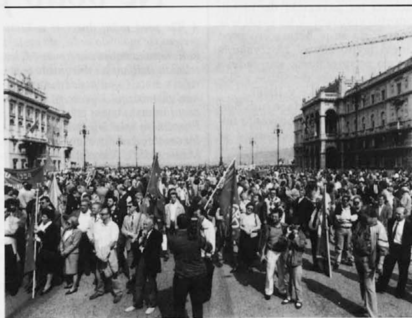
Proomajske manifestacije so letos povsod po Italiji izzvenele kot poziv oblastem, naj si prizadevajo za rešitev zaposlitvenega vprašanja, ki postaja čedalje bolj pereče. Obenem so udeleženci izpričali željo po sožitju in miru, ki ga danes mnogi ljudje niso deležni. Na sliki: udeleženci manifestacije na Trgu Unità