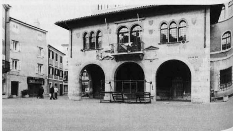
Občinska palača v Miljah