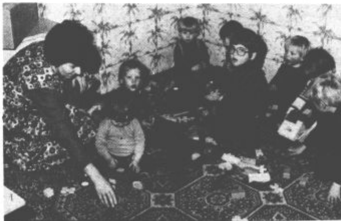
Tudi v privatnem varstvu je potrebno zagotoviti otrokom kar najboljše možnosti za njihov razvoj