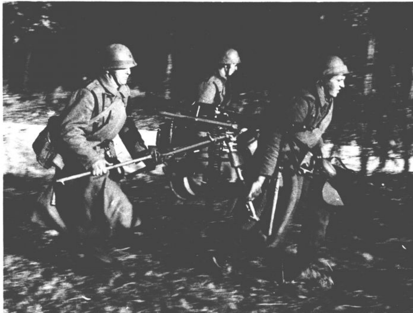
JLA — hrbenica SLO