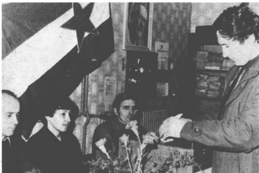
V delovni organizaciji Vegrad Titovo Velenje so imeli v torek, 15. decembra, zbor delavcev, na katerih so spregovorili o težkem gospodarskem položaju. Zadali so si ukrepe za boljše gospodarjenje. Ob tej priložnosti pa so izvedli tudi volitve v samoupravne organe tozdov in delovne organizacije ter referendum o pristopu k poslovni skupnosti Fermin in Skupnosti za proizvodnjo hrane.