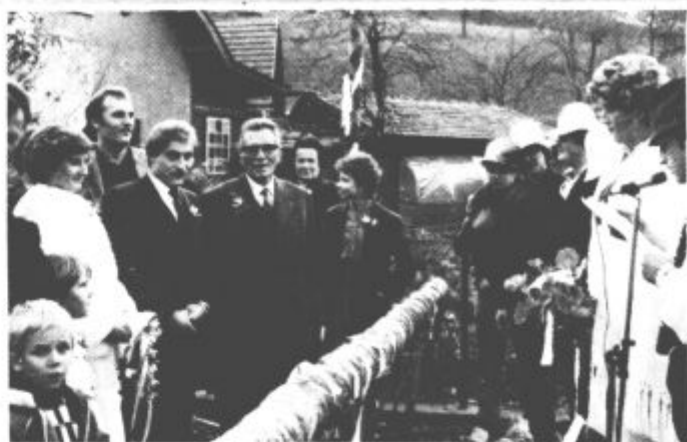
Šranganje pred nevestino domačijo v Šoštanju

»KNJIŽNI DAR« — Izšla je redna letna knjižna zbirka Prešernove družbe s koledarjem za leto 1982. Zbirka petih knjig v broširani izdaji stane 350 din, vezanih (broširani je le koledar) pa 450 din. Naročite jo lahko v najbližji knjigarni, pri poverjeniku družbe ali na naslov: PREŠERNOVA DRUŽBA, Borsetova 27, Ljubljana.