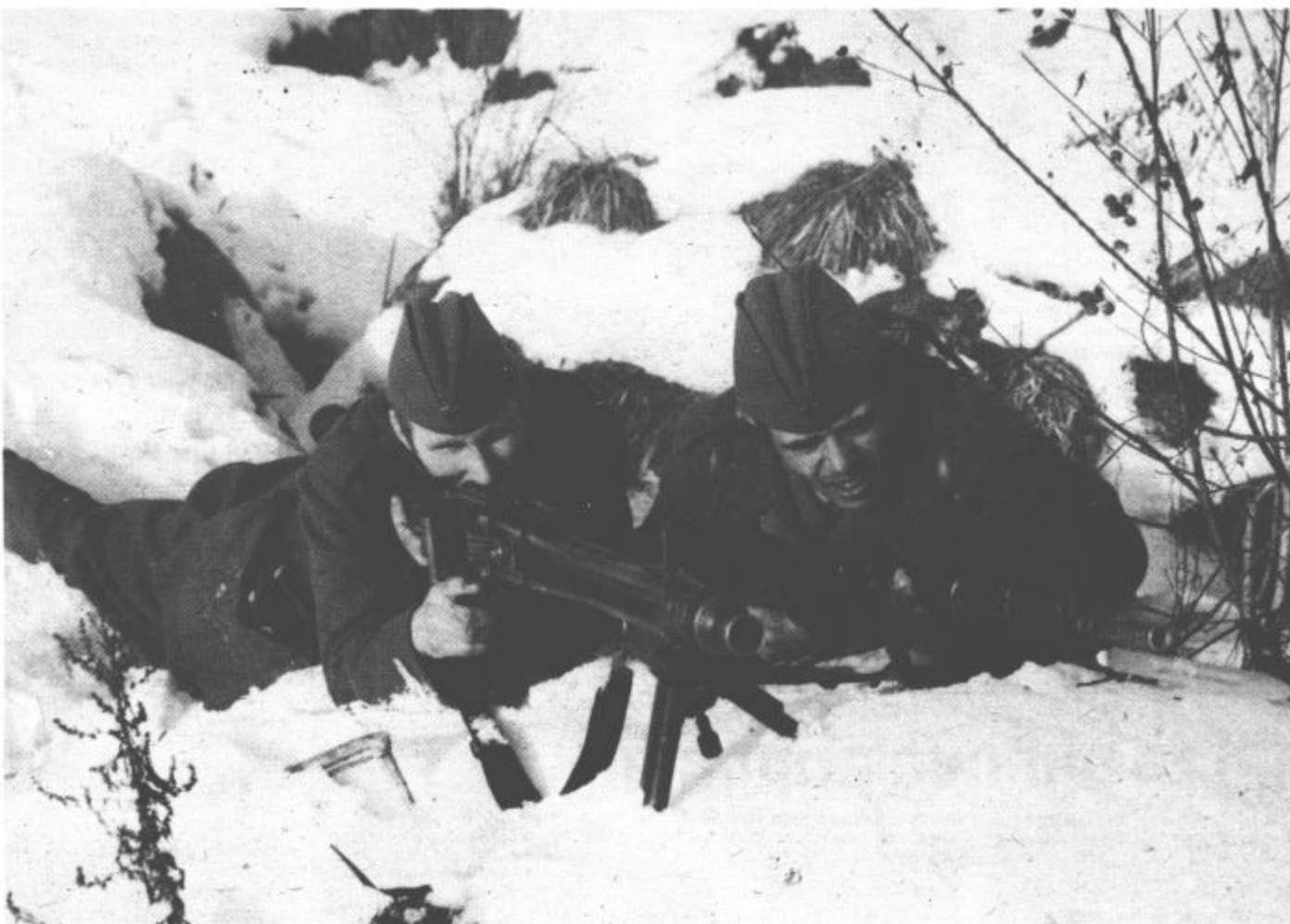
Ob dnevu JLA

Naročene objave za novoletno številko (razpise, obvestila in male oglase) bomo sprejemali do srede, 23. decembra do 12. ure.