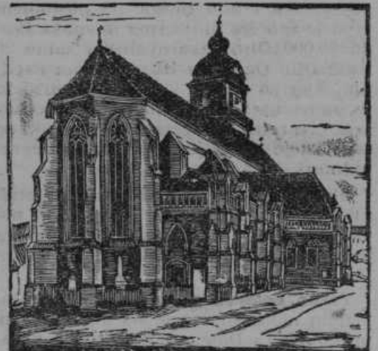
Mariborska stolna cerkev, pred katero so se posvetili Lavantinci presv. Srcu.