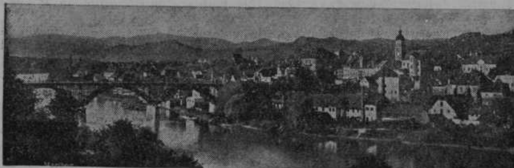
Pogled na Maribor, kjer se je vršil evharistični kongres