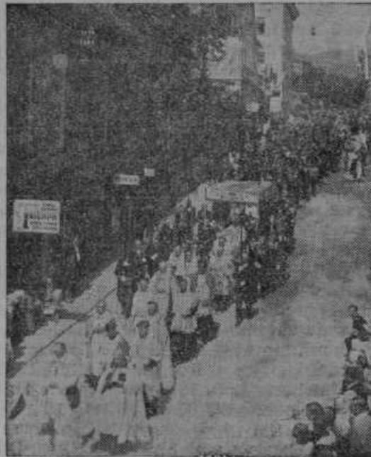
Procesija z Najsvetejšim na evharističnem kongresu v Mariboru.