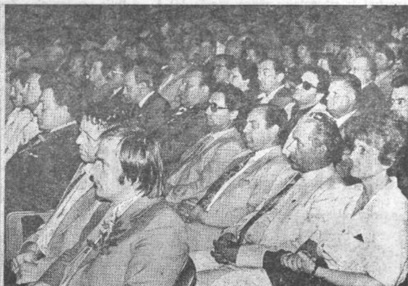
Slovesnosti ob praznovanju občinskega praznika so se udeležili številni družbenopolitični delavci

posleni starši v skrbi za svoje malčke še vedno zaman trkajo na vrata vrtcev. Uresničevanje programa samoprispevka III bo prispevalo k delni rešitvi tega problema. Prostorski problemi osnovnih šol so v glavnem rešeni. Potrebe po novih šolah se kažejo predvsem v novih soseskah. V celodnevno šolo je vključeno 12 odstotkov vseh otrok, v podaljšano bivanje jih je vključeno 21 odstotkov.