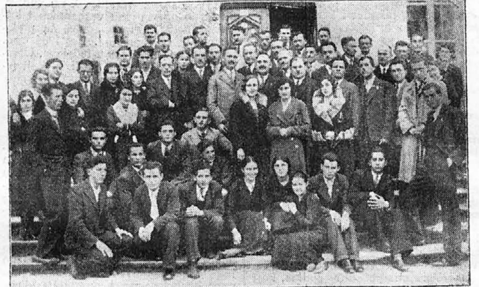
Prvi prosvetni tečaj Sok. župe Cetinje, održan od 14 do 19 novembra 1933

Tečajcima je bilo omogućeno da prisustvuju »Njegoševom večeru« koji je priredilo Sokolsko društvo Cetinje. Pregledali su narodni muzej i dr. znamenitosti.