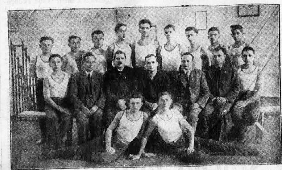
8 okružnog prednjačkog tečaja u Vukovaru, održanog od 3 do 13 dec. 1933