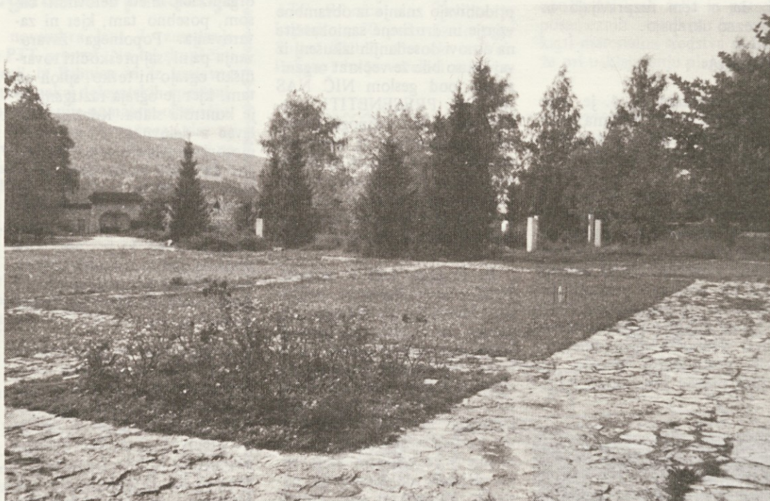
Grajski park v Ribnici, kjer je park kulturnikov v glavnem že urejen. Poleg parka kulturnikov so tu še letno gledališče (ki ga ne uporabljajo), etnografski muzej, likovna galerija na prostem, Petkova galerija in poročna dvorana. Sploh je park tudi prijetno sprehajališče in okolje za občasna divjaška razbijanja mladih vročekrvnežev.