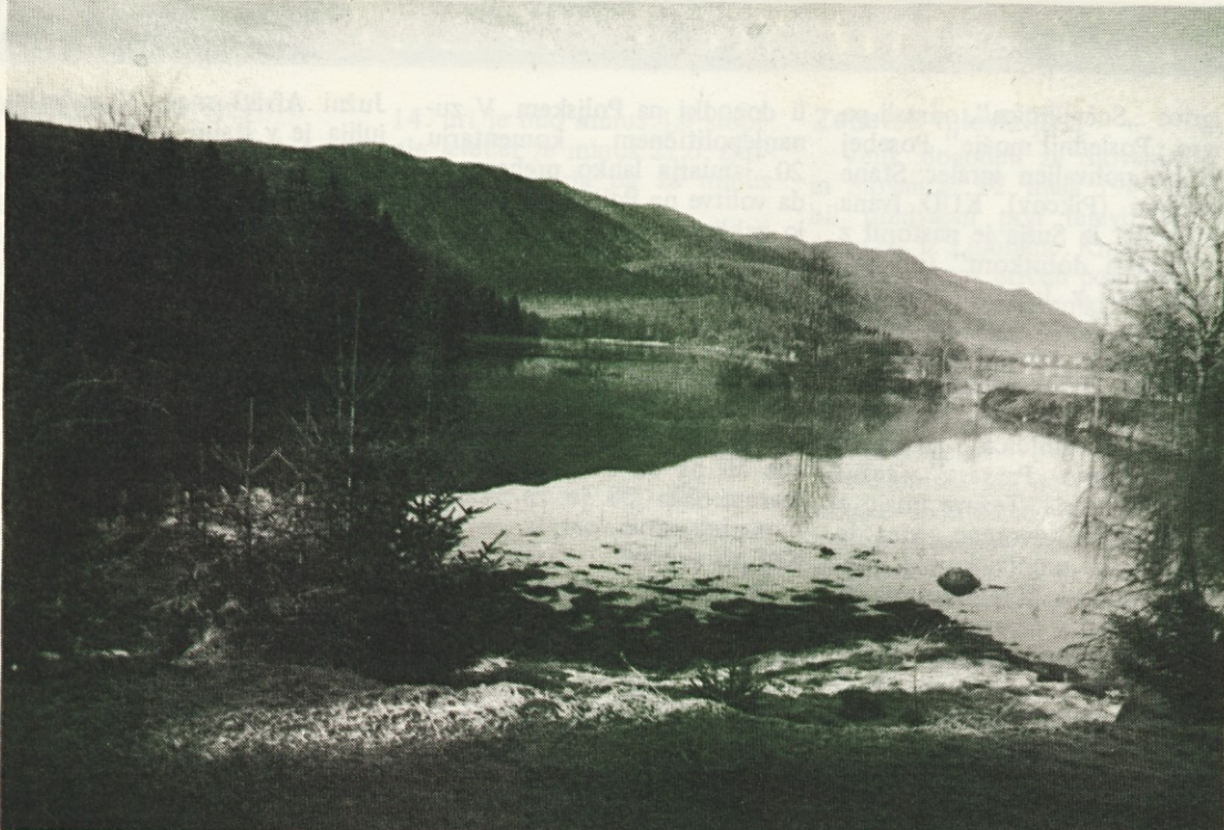
Del dolnjevaškega polja je kot jezero in to večkrat na leto za dlje časa. Tedaj se proti Kočevju vozimo kot po napisu. Seveda je zaradi vode (pa tudi zaradi odnosa do kmetijstva) dolnjevaško polje polje zvečine le še po imenu, sicer pa bolj spominja na zamočvirjen travnik. Jezero, ki naj bi preprečevalo podobna poplavljanja, pa bo nekaj kilometrov višje, od Prigorice proti Ribnici oziroma Ugarju.