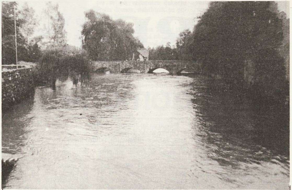
Potok Bistrica, ki teče skozi Ribnico, postane včasih kar nasilna reka, ki poplavlja, podira in uničuje vse pred seboj. Taka je Bistrica vsaj dvakrat na leto, raje tudi pogosteje. Umiril naj bi jo predvideni zadrževalnik nad Prigorico. Opredelitev za gradnjo zadrževalnika je bila že sprejeta, vojna proti njemu, čeprav ga še niso pričeli graditi, pa se je šele prav začela. Ribniško vodovje pa veselo poplavlja . . .

Novost v volilni zakonodaji je v načinu volitev delegacij za