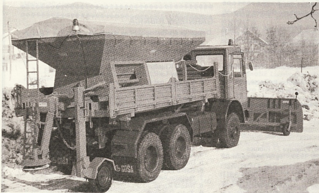
Del cestne mehanizacije. Posipalec peska in soli je izredno pomemben proizvod za našo zimsko cestno službo.

V čem je skrivnost uspeha? V delu, zavzetosti, iznajdljivosti, v odrekanju in vlaganju kolektiva v svoj lastni razvoj, v osvajanju novih proizvodov, razvijanju le-teh na osnovi sodobne tehnologije ter v izjemno