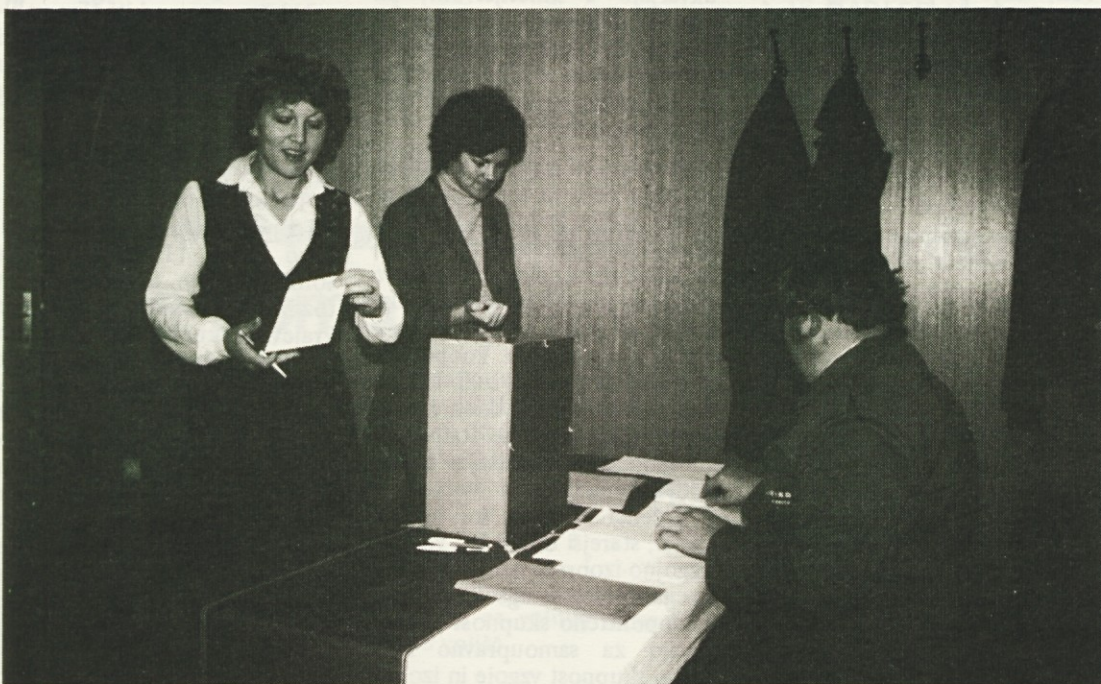
Volišča za volitve delegatov in delegacij 11. in 14. marca naj bodo povsod lepo urejena in okrašena. Volitve so pomembno opravilo, ki ga ne moremo opraviti mimogrede. Primerno naj bo tudi okolje . . .

Delegate družbenopolitičnega zbora skupščine občine Ribnica volijo vsi volilci v krajevnih skupnostih 14. marca. Način volitev je tak, kot v letih 1974 in 1978, se pravi, da glasujemo z „za“ ali „proti“ za celotno listo družbenopolitičnega zbora. Listo kandidatov zbora je oblikovala Socialistična zveza na osnovi dogovora z drugimi družbenopolitičnimi organizacijami v občini. Po tem dogovoru delegirajo v družbenopolitični zbor občinska vodstva družbenopolitičnih organizacij iz sestava občinskih vodstev skupno 23 članov in sicer občinska konferenca SZDL 6 delegatov, občinski svet Zveze sindikatov 6, občinska konferenca ZK 5, občinski odbor zveze borcev 3 in občinska konferenca ZSMS 3 delegate. Člani družbenopolitičnega zbora morajo biti člani občinskega vodstva družbenopolitične organizacije, ki jim je osnovna delegatska baza. Tudi v svojem nastopanju v skupščini oz. DPZ ne zastopajo regionalnih interesov, to je interesov krajevne skupnosti, kjer žive, ali delovne organizacije, kjer delajo, pač pa politična izhodišča družbenopolitične organizacije, iz katere osnovne delegacije izhajajo. Prav okoli te osnovne pripadnosti članov družbeno-