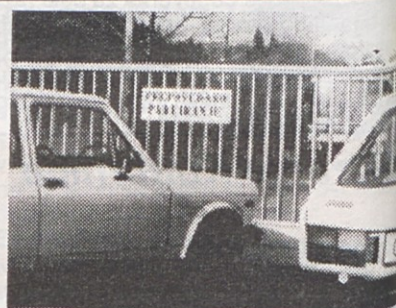
Parkirišče za nepismene