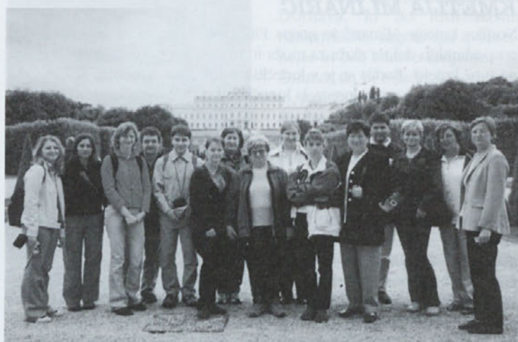
Tečajniki na ogledu Dunaja

Ali poznamo svoj domači kraj, običaje, ljudi, občino Dornava? Pogosto se sprašujemo, ali znamo to predstaviti in pokazati drugim, zato smo se v Odboru za obnovo dvorca Dornava odločili, da organiziramo tečaj za