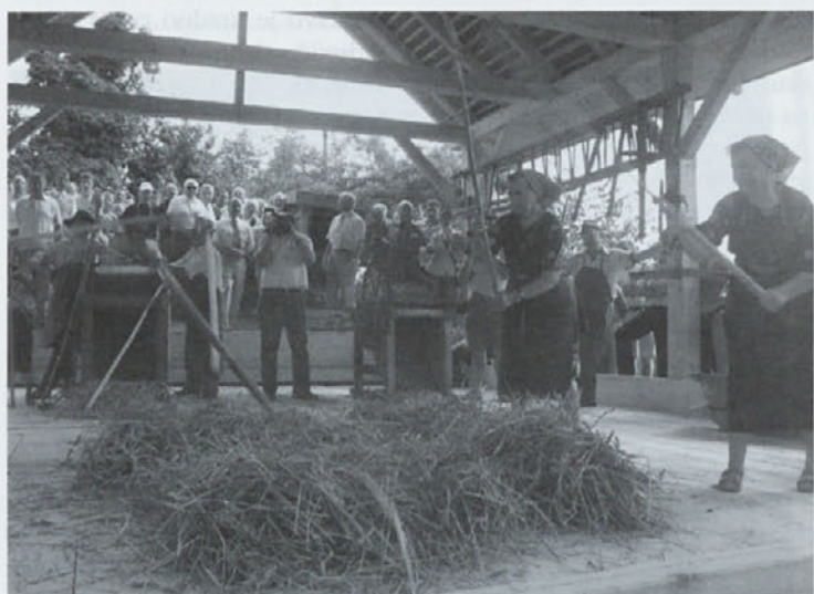
Mlatev s cepmi na novem gūmnu

Oglašamo se iz Turističnega društva Polenšak, v katerem tudi letos z našimi krajanji pripravljamo skupno prireditev oziroma prikaz božične zgodbe v naši cerkvi. Letos jo bomo prikazali 28. in 30. decembra 2003 ob 18.