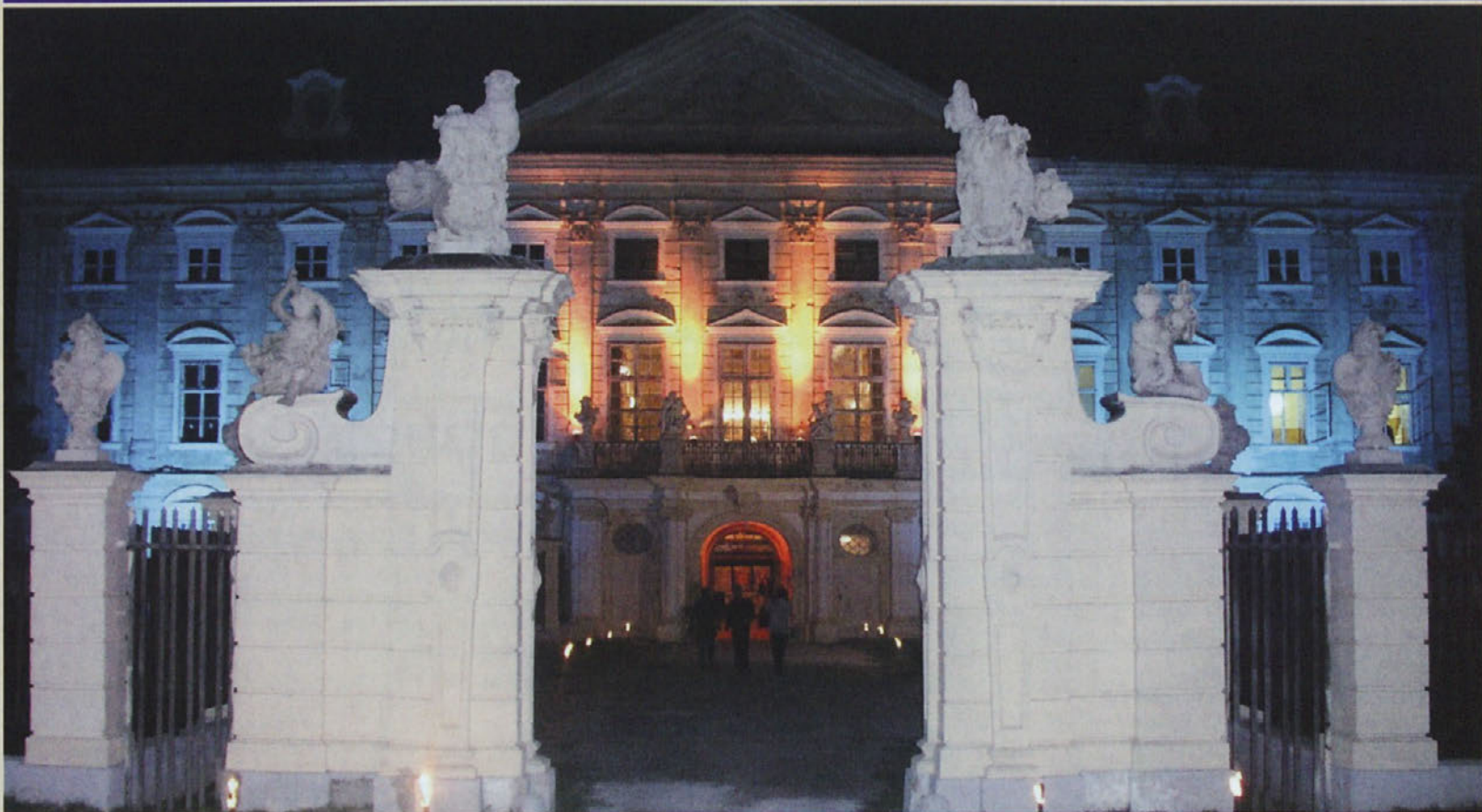
"Oživljeni" dvorec Dornava ob koncertu