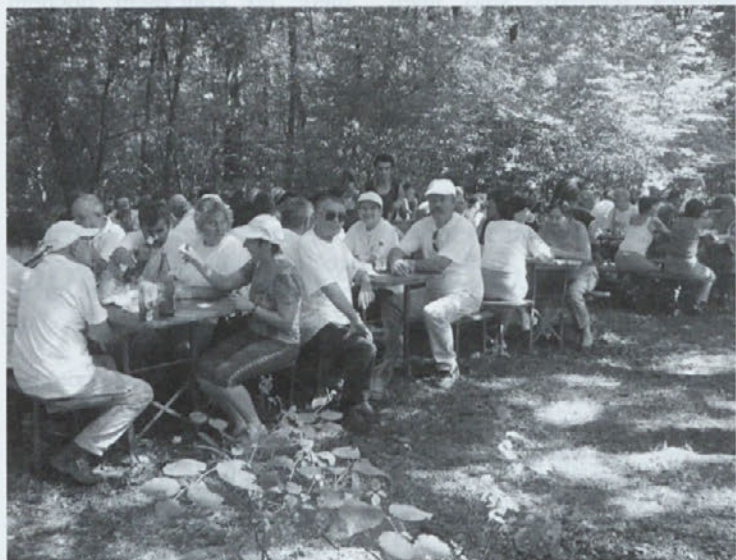
V senci je prijetno

Praznovanje 30. gobarskega praznika je letos potekalo 2. in 3. avgusta, saj so gostje iz Kopra prišli že v soboto.