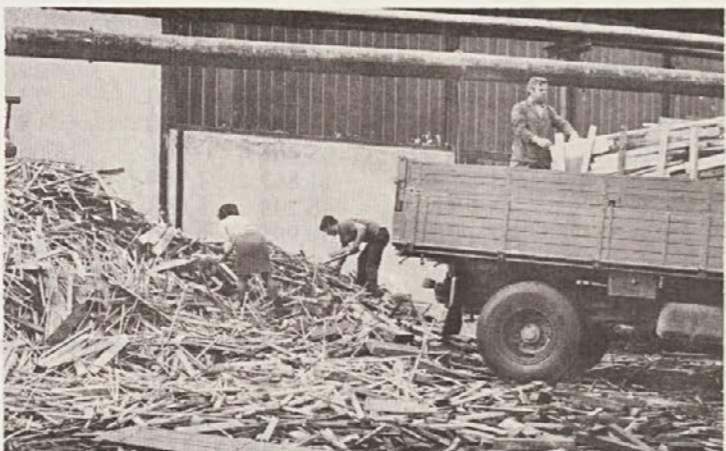
V eni od številčk našega glasila smo objavili fotografijo, na kateri se vidi veliko smeti in tabla „Odlaganje smeti prepovedano!“. Na udarniško soboto smo pospravili tudi te smeti.