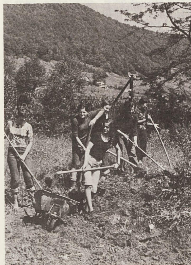
Naše udarnice so sodeč po elanu resnično „garale“.