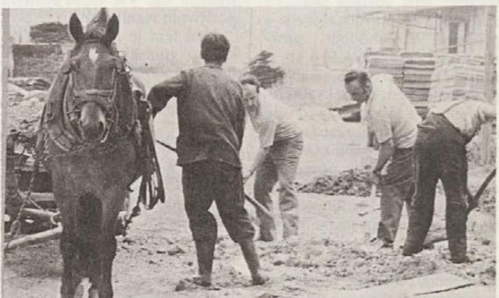
Kot pri TSP, so betonirali cesto tudi pri TVP. Zahtevno in težko nalogo so odlično opravili.