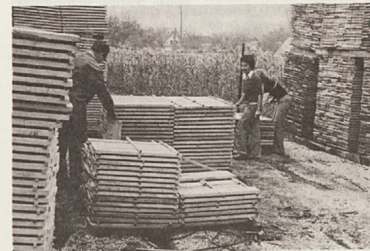
Vse je moralo biti točno zloženo, vse kot v skatlici. Delavci TDP so rekli, da že dolgo niso imeli tako lepo zloženega lesa.