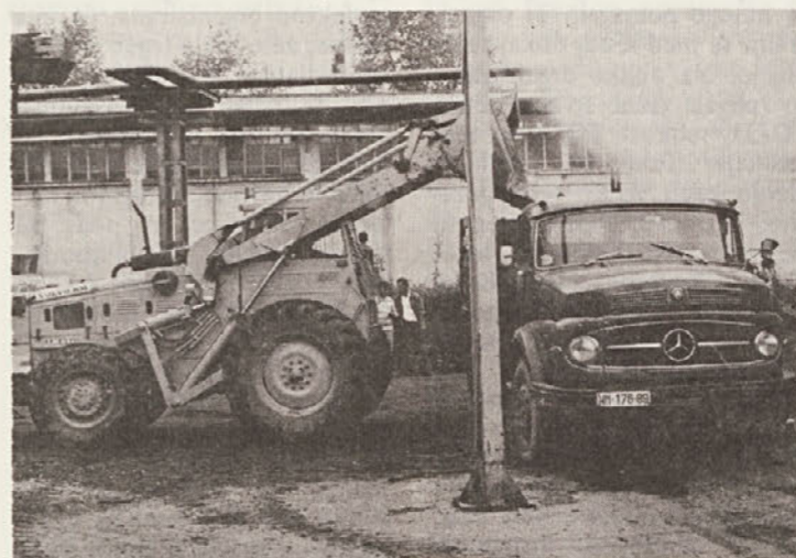
Niso delali samo delavci, tudi stroji so nam kar pridno pomagali.