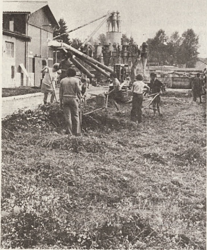
Cela akcija je izvenela v borbenem duhu, kot nekoč, ko so bile take akcije na dnevnem redu.