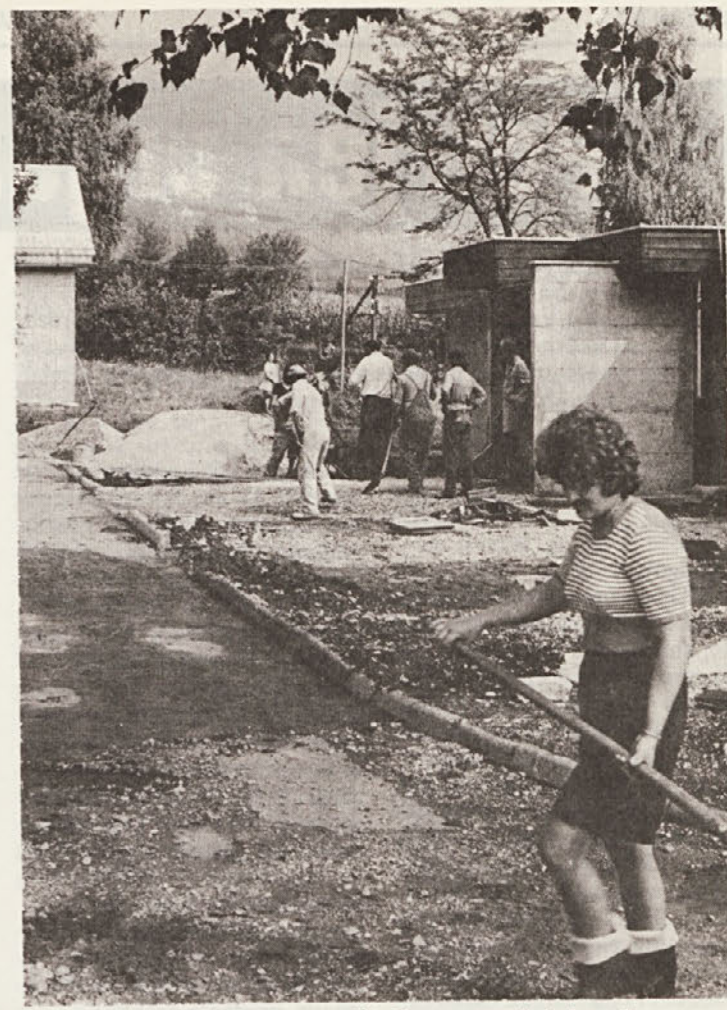
Okolje kuhinje smo lepo uredili. Za to so poskrbele naše punce.