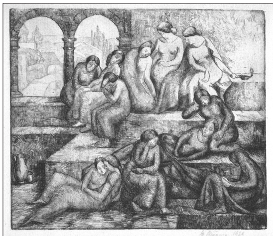
Slika 4: Elda Piščanec, Speče device , 1929, jedkanica, zasebna last

Obravnavano delo Elde Piščanec prinaša v tradicijo upodabljanja aktov tudi nove načine predstavitve ženskega telesa kot objekta pogleda. Upodobljenki na sliki Dekleti ne spadata več med akte z reprezentiranimi ženskima telesoma, ki bi se nahajala zgolj v vlogah gledanih erotiziranih objektov, temveč ju lahko razumemo v bolj feminističnem smislu kot podobi žensk, ki se kljub objektivizaciji nahajata tudi v hkratnih pozicijah gledajočih subjektov.