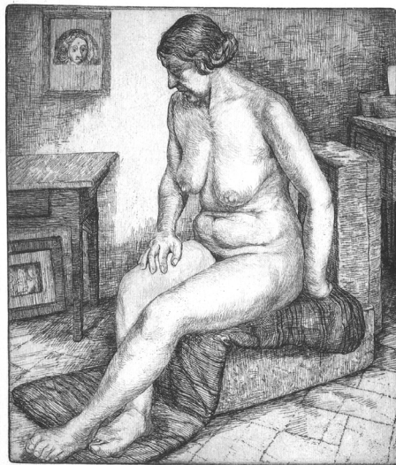
Slika 3: Elda Piščanec, Akt, ok. 1928, jedkanica, zasebna last

Dela Elde Piščanec vsekakor že razkrivajo feministični pogled na žensko telo. 13 Takšno razu-