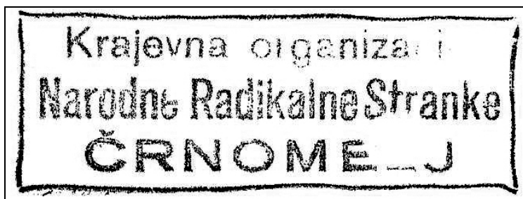
Žig Narodno radikalne stranke v Črnomlju.