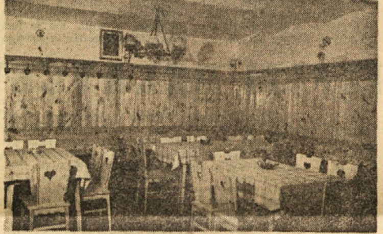
Gostišče v Delavskem domu

bovljah je izdelalo in tudi postavilo republiko podjetje »Tesar«, obrat Smartno pri Litiji, ki je na svoje delo lahko ponosno. Ta delovni kolektiv je uredil tudi gostinske prostore Planinskega doma na Sv. Gori nad Zagorjem. V nekdanjih temnih, kletnih in prizemnih prostorih Delavskega doma v Trbovljah imamo