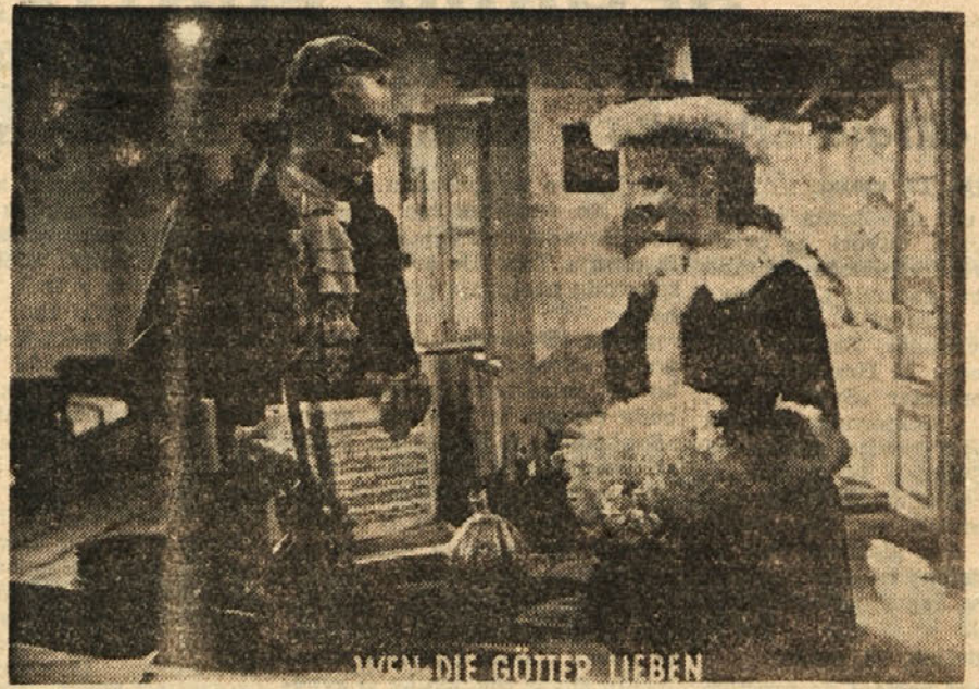
Prizor iz filma »Kogar bogovi ljubijo«

Po osvoboditvi smo elektrificirali že vrsto vasi, tako Vače in Slivno, pa Riharjevce, Javorje nad Litijo in Vintarjevec. Prav v zadnjem času pa Zavrstniško dolino. Dne dve dovršujejo dela na elektrifikaciji Jevnice, Goliš in Male dolge noge. Poleg teh vasi smo elektrificirali še vrsto drugih krajev. Ta teden pa so podpisali pogodbo za elektrifikacijo hribovske vasi Leše, pod znano planinsko točko Sv. Goro. Stroški za napeljavo elektrike bodo znašali nad dva milijona dinarjev. Del stroškov bo krila ljudska oblast, ostalo pa vaški odbor za elektrifikacijo. V načrtu za elektrifikacijo pa so zdaj še vasi Konj in Bitiče nad Litijo. Akcija za napeljavo elektrike pa se vrši tudi v vasi Stangi pri Litiji. Ljudje se zavedajo važnosti elektrifikacije. Petrolejke se umikajo, moderni napeljavci. V najkrajšem razdobju bo potegnena žica, ki prinaša svetlobo in delovno silo še v druge vasi litijske okolice.