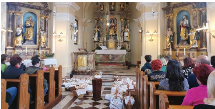
Blagoslov velikonočnih jedi v cerkvi sv. Katarine.