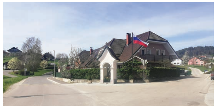
Začetek Rafolč v 'to vas' ali 'uno vas' z znamenjem sv. Katarine in slovensko zastavo.

Rafolče so gručasto naselje, ki leži na pobočjih nadmorske višine 371 metrov severno od potoka Vrševnik, ki priteče izpod Straže čez ravni del Lašč, kjer je bilo včasih nogometno igrišče. Do njega dostopamo, ko na cesti med Šentvidom pri Lukovici in Brdom pri poslovilnem objektu zavijemo levo, saj se nahajajo na severni strani zahodnega dela Črnega grabna. Sestavljata ga spodnja in zgornja vas, med katerima teče potok Čedave, vaščani pa eni strani pravijo »ta vas«, drugi pa »una vas« in obratno. Člani ŠTD Rafolče so hudomušno namestili dva smerokaza z oznako »una vas« in »una vas«.