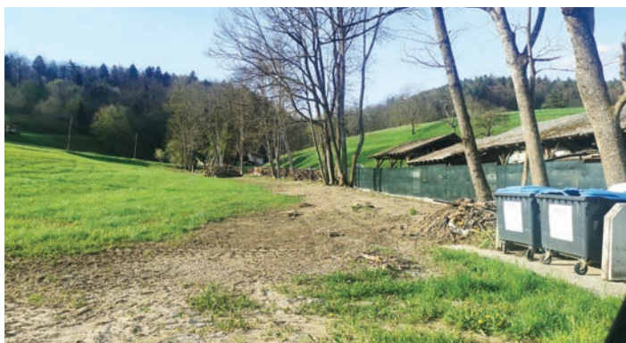
Posek in čiščenje Čedave.

Pred kratkim je bila v precejšnji meri izvedena ureditev potoka Čedava.