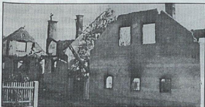
Požig v Bizoviku