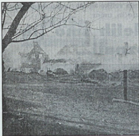
Vas Topol na Blokah, ki jo je „narodno- osvobodilna vojska“ požgala 10. novembra 1942