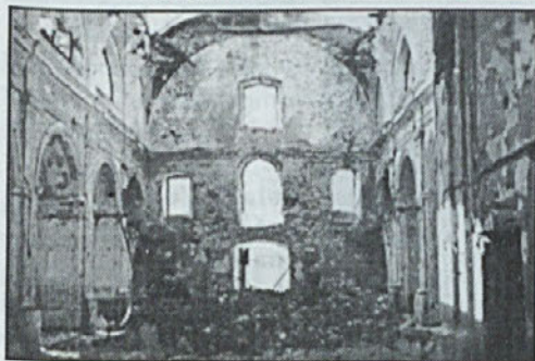
Cerkev v Žužemberku