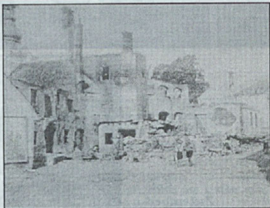
Pogled na starodavni trg Žužemberk po napadih „narodno- osvobodilne vojske“ julija 1943