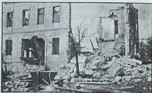
Šola v Žužemberku