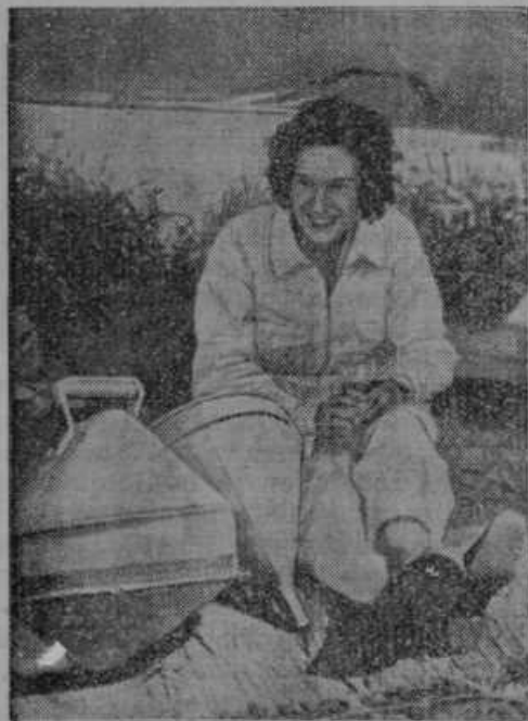
Rekordni polet angleške letalke Jeane Batton preko Atlantika. Letalka je rabila iz Dakara v Afriki v Južno Ameriko 15 ur in 15 minut.