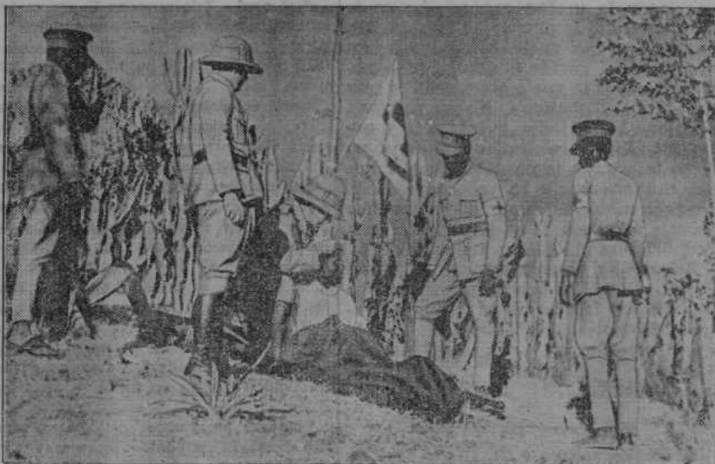
Amerikanske Rdeči križ obvezuje abesinske ranjence.