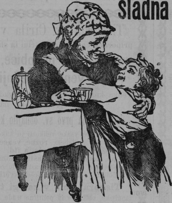
Stara mamica, še menj!

13 leta sem izprijčano izvrstna primes k bobovi kavi. — Pri živčnih, srčnih, žilodecnih boleznih, pri pomanjkanju krvi etc. zdravniško priporočena. — Najprijetnejša kavina pijača v stotisočero rodovinah.