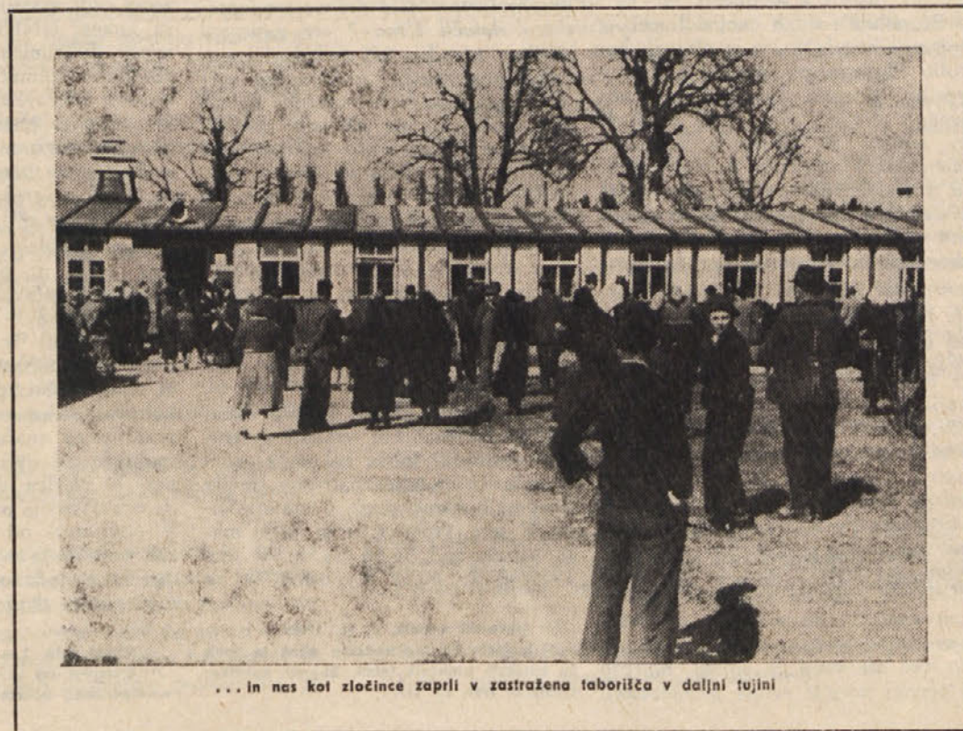
... in nas kot zločince zaprli v zastražena taborišča v daljni tujini