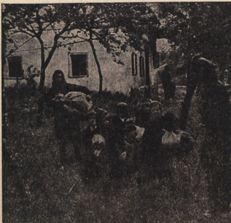
... ko so nas z oboroženo silo pregnali z rodne grude ...