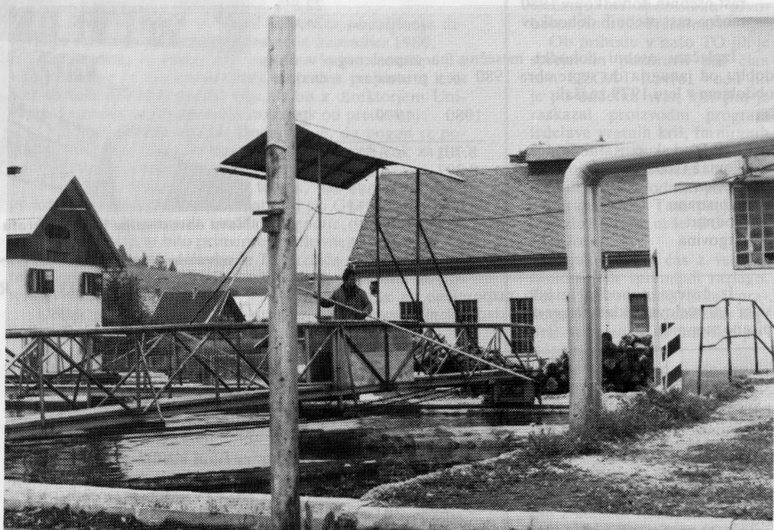
Hlodar na bazenu