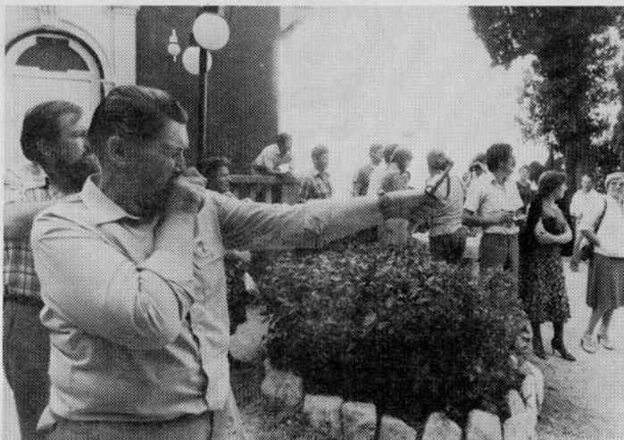
Streljanje s fračo v žarnice

Zelo rad potujem po naši domovini. Naj opišem zadnji izlet, kateri mi bo ostal kot eden izmed najlepših v spominu.