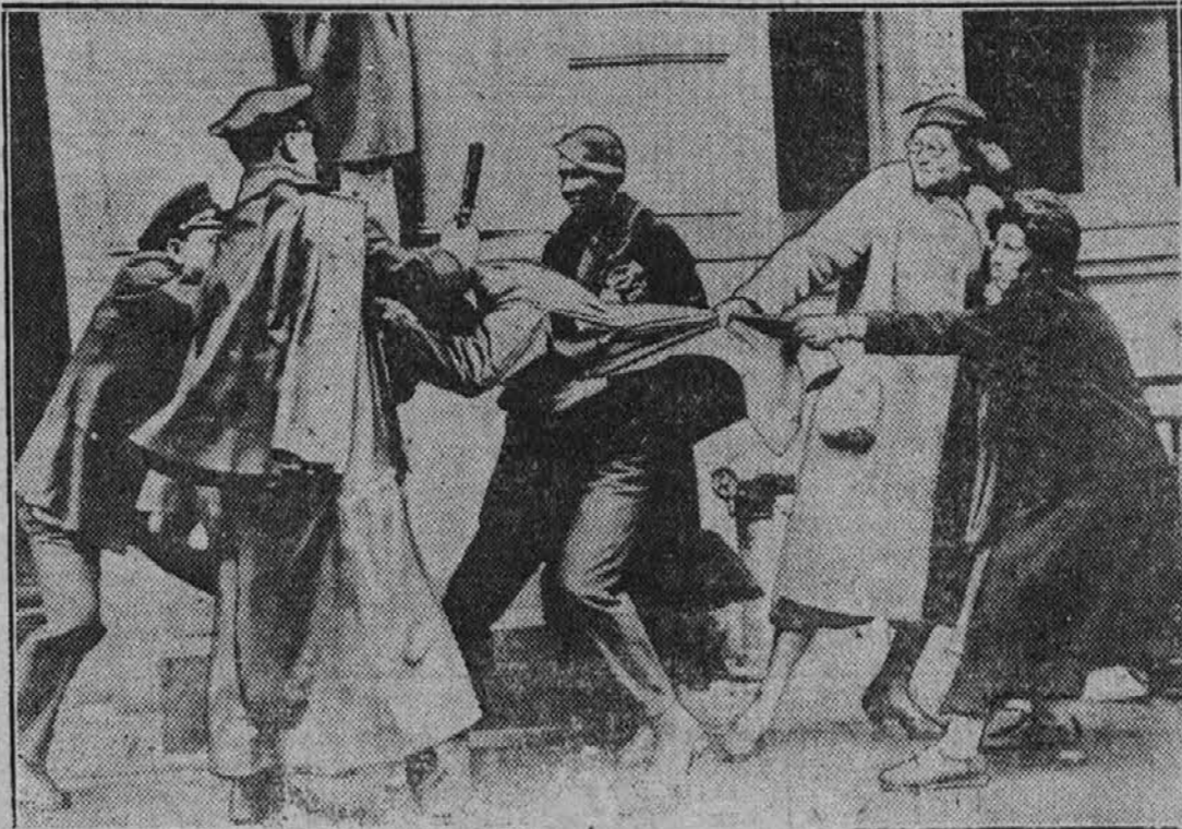
Gornja slika je bila vzeta ob demonstracijah, ki so jih brezposelni nedavno vprizorili v New Yorku, in kaže nekega izgreznika, ki se mu ne godi posebno dobro. Na eni strani ga drži policija, dočim ga na drugi strani vlečejo za obleko njegovi somišljeniki, da bi ga policiji iztrgali.