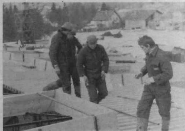
Delavci Termike veliko delajo tudi za Bežigradom. Pred kratkim so končali dela na športno rekreacijskem centru Ježica, zdaj pa delajo na novi osnovni šoli na Črnučah, od koder je naš posnetek.

Največje načrte pa imajo v ljubljanskim Montažah. Delavski svet je že sprejel sklep o programskih osnovah investicije za gradnjo proizvodnega in skladiščnega objekta v Ljubljani, ki bo stal ob današnji kovinski delavnici na Kamniški 25 za Bežigradom.