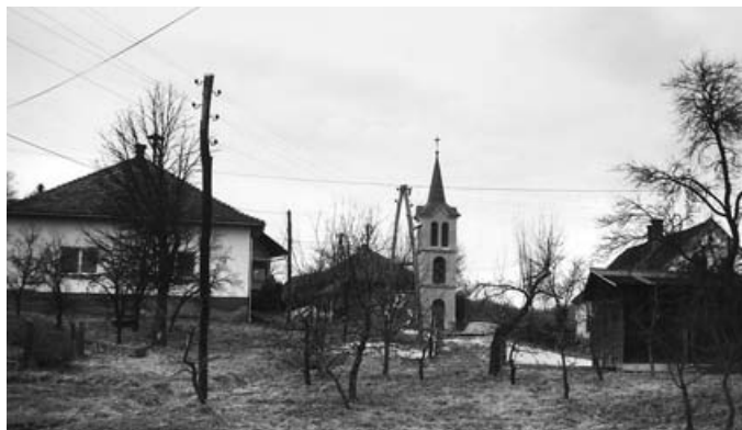
Vaški dom in zvonik pred obnovo.

Letos bo imel precej dela, saj tukajšnje gasilsko društvo praznuje poletni 80. obletnico ustanovitve. Do takrat bi radi končali začeta dela na domu ter obnovili streho, okna in fasado zvonika. Za obnovo »törna« so predvideli nekaj več kot tri milijone tolarjev. Zvonik iz 1941. leta enako služi evangeličanom in katoličanom.