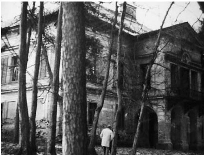
A romos állapotú pártosfalvi kastély, amely a helybeli iskolások kutatási tárgyát képezte, revitalizációja sürgős, ha meg akarjuk őrizni az utókor számára.