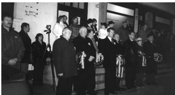
A pártosfai kopllyafánál a nemzetiségi tanács, Magyarország szlovéniai nagykövetsége, a szomszédos magyarországi önkormányzatok, a magyar nemzetiségi művelődési intézet képviselői helyezték el a koszorúkat.