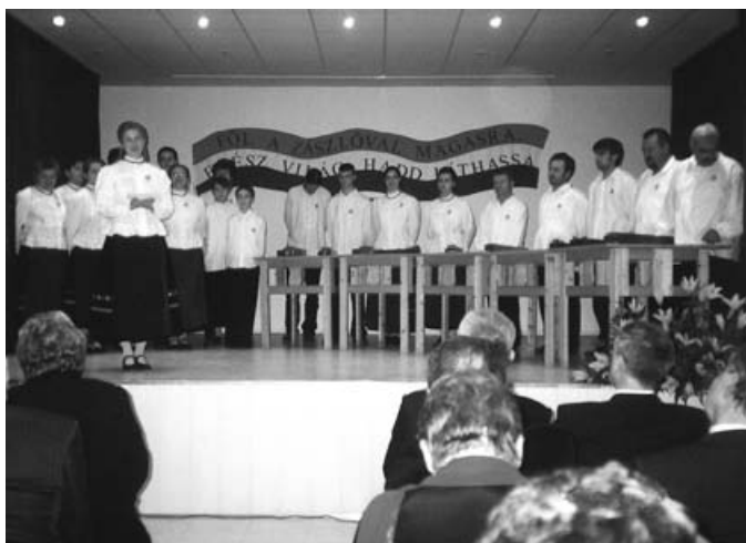
A Vas megyei jeles osztályszonyfalvi citerások és vegyeskórus bemutatkozásával zárult a Moravske Toplice-i község március 15-ke alkalmából rendezett központi ünnepély.