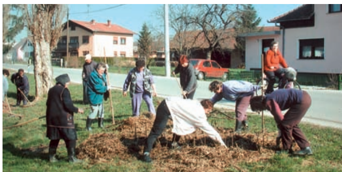
ČIŠČENJE OKOLJA – V aprilu smo v občini čistili okolje, v maju bo odvoz kosovnih in nevarnih odpadkov. Odziv na čistilno akcijo je bil dober, res pa je, da rezultatov ne moremo meriti le v tonah nagrabljenih