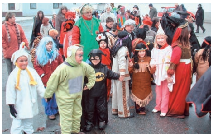
PUSTOVANJE V MORAVSKIH TOPLICAH – Le kdo bi lahko preštel vse maske, ki so se zbrale v Moravskih Toplicah na pustno soboto! In koliko inventivnosti, skrbnosti in potrpljenja zahtevajo priprave, zlasti