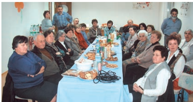
ŽIVIMO ZDRAVO V TEŠANOVCIH – Začetno ali nadaljevalno obliko akcije ZZV M. Sobota izvaja kar v 48 krajih Pomurja. V naši občini so pred tremi leti prvi pričeli v Martjancih, lani so se jim pridružili občani Bogojine in Prosenjakovec, letos se v Tešanovcih.