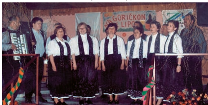
Ljudski pevci Pevskega društva Selo na predstavitvi svojega prvega zvočnega medija.