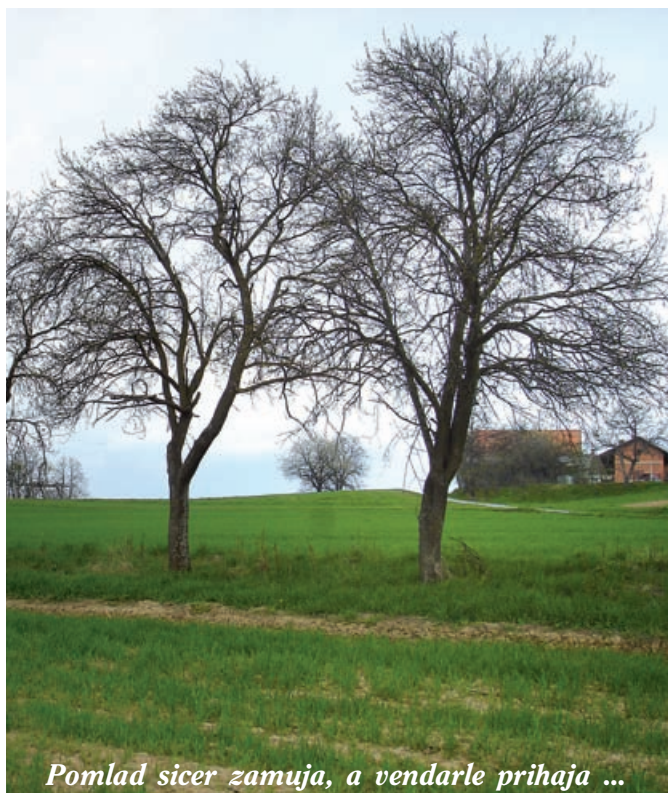
Pomlad sicer zamuja, a vendarle prihaja ...