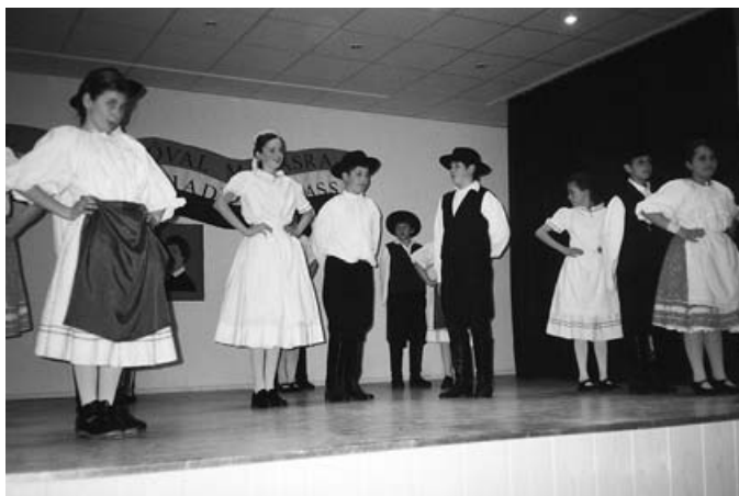
A pártosfai iskola népi együttese a szélesebb térség magyar táncait és dalait vitte a színpadra

A magyar nemzet ünnepére, a márciusi ifjakra, a nemzeti mozgalomra emlékezve a Moravske Toplice-i község nemzetiségileg vegyesen lakott területén március 11-én tartották a központi ünnepélyt az öt falu lakossága, valamint számos külföldi és hazai vendég jelenlétében. Egy hónap távlatából képeken számolunk be a jeles eseményről.