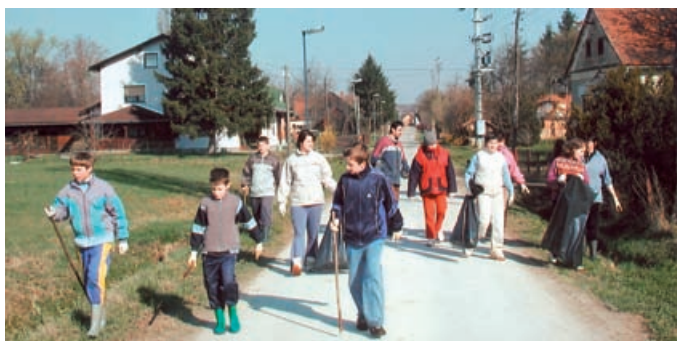
smeti, saj so marsikje posvetili pozornost zunanji podobi javnih površin in – tako kot v Prosenjakovcih – urejali zelenice in cvetlične grede. V Motvarjevcih je fotoreporter ujel večjo skupino mladih »čistilcev«.