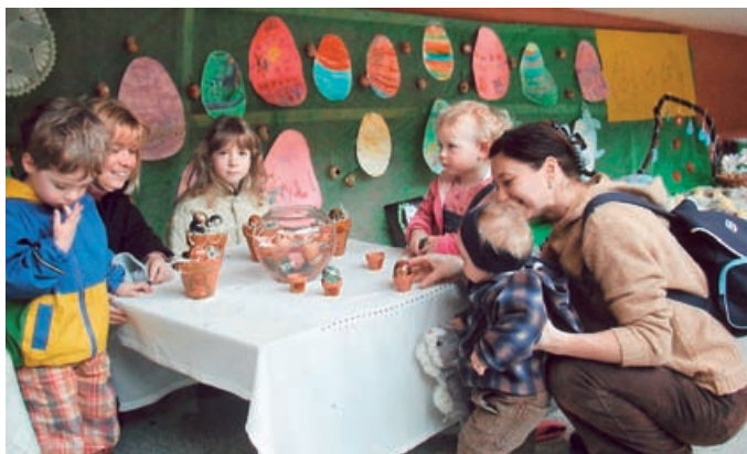
DITEČI VŮZEN IN VELIKONOČNE RAZSTAVE – V avli hotela Vivat v Moravskih Toplicah so se s kulturni programom in velikonočno razstavo predstavili malčki moravskega vrtca na prireditvi Diteči vůzen. V marsikaterem kraju so pripravili delavnice