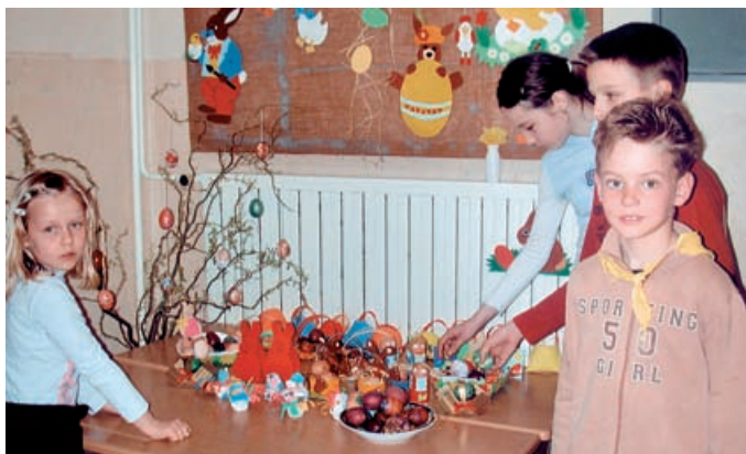
ali razstave. V Martjancih so z velikonočno razstavo sklenili skoraj mesec dni trajajoče aktivnosti, ki so med drugim vključevale delavnice. Na sliki desno: učenci podružnične sole Tešanovci z izdelki velikonočne delavnice.