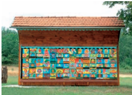
Čebeljak v Ivanjševcih.

Območje Nature 2000, ki se skoraj v celoti prekriva z območjem Krajinskega parka, je pomemben steber pri varovanju narave v Evropski uniji. Hkrati je to tudi priložnost zavarovanja naravne dediščine s pomembnimi živalskimi in rastlinskimi vrstami ter življenjskimi okolji. Zavarovanje območja Goriškega tudi na ta način je priložnost zavarovanja naravnih bogastev, ki so v zahodni Evropi skoraj izginila, na Goričkem pa so jih pridne roke prebivalcev ohranile do danes. Namen Nature 2000 je vzpodbujanje aktivnosti za ohr-