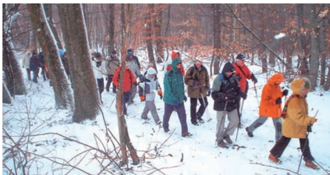
POHOD PO SLADKI POTI – Vztrajni organizatorji so v zimskih razmerah uspešno izvedli Pohod po Sladki poti. Ko sem v zadnji številki Lipnice našteval pohode, sem izpustil najstarejšega: Pohod po poti kulturne dediščine v Bogojini.