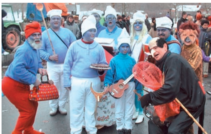
ko gre za domišljene zamisli skupinskih mask! Po tradiciji sodelujejo tudi najmlajši – malčki iz vrtca in solske skupine. Komisija je med skupinskimi maskami nagradila Smrkce KTD Tešanovci.