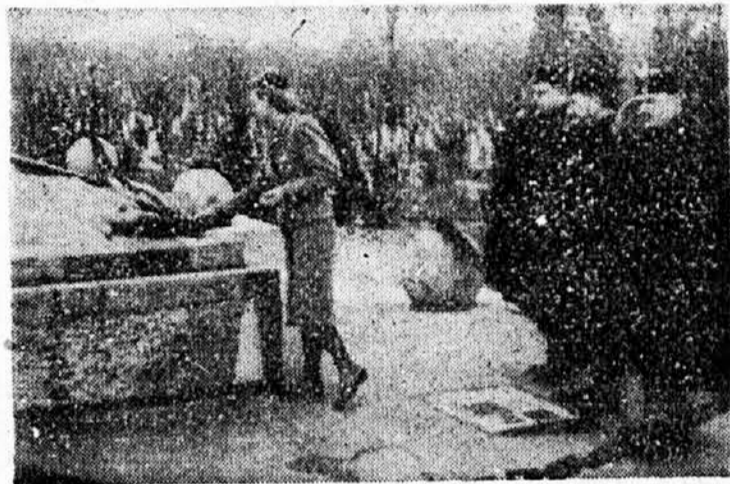
Делегација Савеза Сокола код споменика браниоцима Београда

бодну Краљевину Југославију. Брат В. Поповић је казао даље: „Наша слобода створена је грвљу. Соколство прославља Први децембар као свој највећи празник, јер је тога дана први пут створена заједничка слободна држава Срба, Хрвата и Slovenaca. Први децембар представља уједно дан пречишћавања наше народне душе; у њему лежи наша морална снага и зато ће га соколство увек прослављати као што је то и досада чинило. Наш народ и држава отклањаће све тешкоће. Првог децембра заборављају се