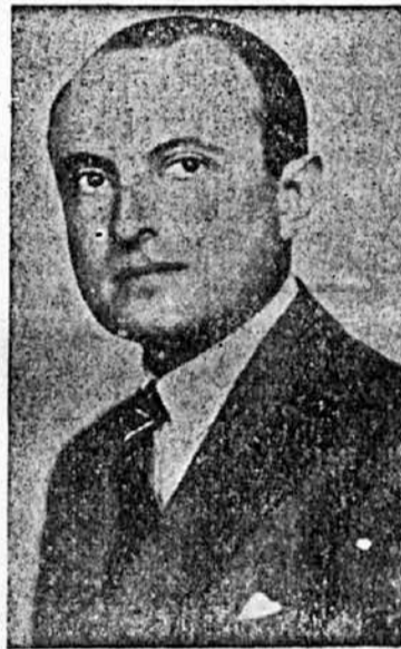
Његово Краљевско Височанство Кнез Намесник Павле

Њ. Кр. Вис. Кнез Намесник, је мирним, јасним и одлучним гласом, који је нашао најдубљег одјена у Срцу југословенског соколства, казао: