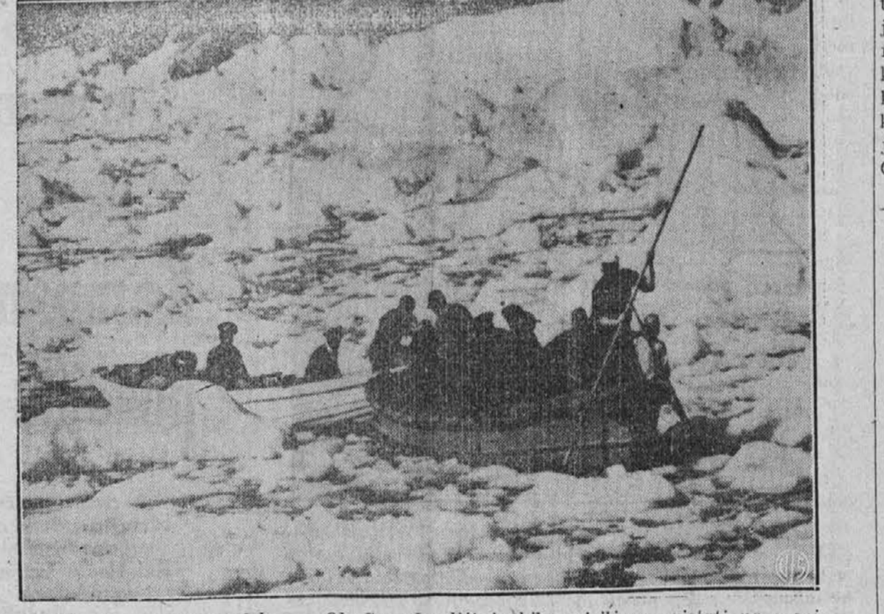
Obrežna straža na delu. — Ob Greenlandiji je bilo prisiljeno pristati na morju ameriško letalo in moštvo bi bilo gotovo zmrznilo, da ga ni opazila obrežna straža, ki je potem z malimi čolni, kot vidimo na sliki, rešila ponesrečene letalce gotovo smrti.