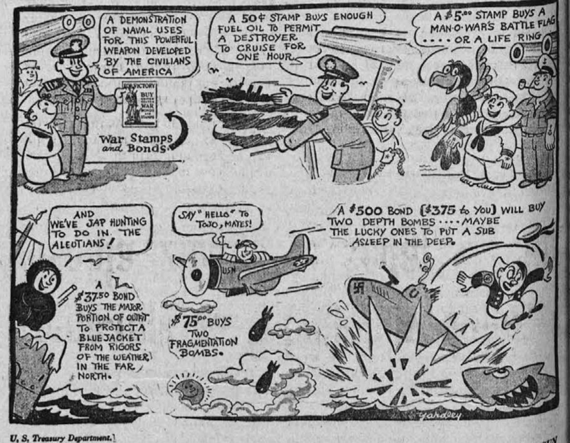
U. S. Treasury Department.