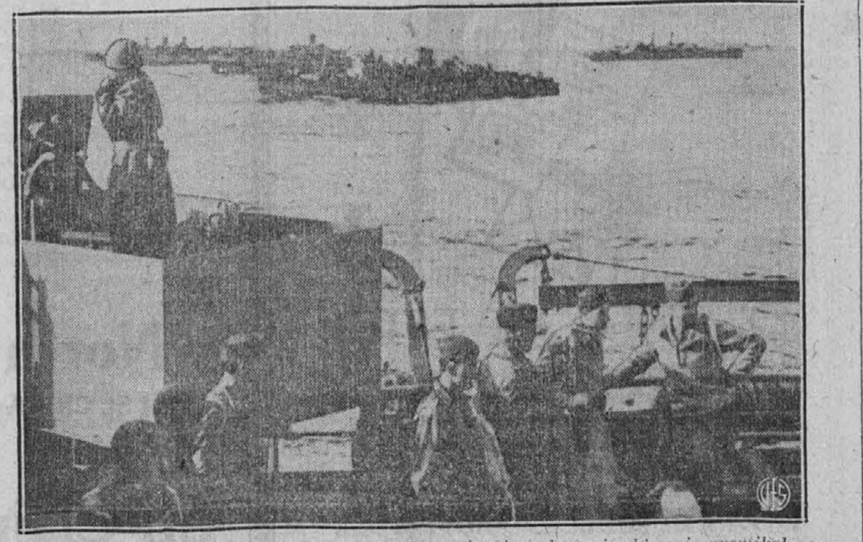
Na sliki vidimo skupino lažij, ki so le del največjega konvoja, ki se je premikal po Sredozemskem morju v sedanji vojni in srečno prepeljal ameriško vojaštvo v Severno Afriko.