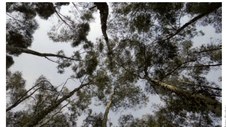
Plantaža evkalipta na Portugalskem. Eucalyptus plantation in Portugal.

Sodelujoči smo bili enotnega mnenja, da je vsak ostanek ali odpadki lahko potencialna surovina, ki jo je možno predelati v tržno zanimive produkte, saj s tem poskrbimo za kroženje materialov ter boljšo ekonomsko in ekološko bilanco.