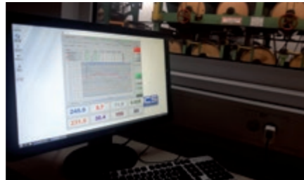
Spremljanje parametrov na monitorju v kabini za operaterje Monitoring of the paper quality and process parameters in the operator booth

Papirni stroj Inštituta za celulozo in papir je po novem opremljen z osnovnim sistemom za nadzor kakovosti QCS (Quality control system), kar se je še pred nekaj leti zdelo »misija nemogoče«. Uspelo nam je najti uspešnega in zainteresiranega proizvajalca teh naprav, ki opremlja tudi male stroje, kakršen je naš, saj veliki opremljevalci za nas niso imeli ustreznih rešitev. Gre za podjetje MCS z Nizozemskega, kjer so bili zelo odzivni. Poskrbeli so za dobavo in montažo dveh merilnih okvirjev. Enega so namestili takoj po mokrem delu papirnega stroja, drugega pa na koncu sušilne skupine. Odslej lahko s sistemom QCS spremljamo meritve in profile gramature na mokrem delu in končne gramature, delež vlage, debeline, delež pepela, hitrost in širino papirja. Rezultati meritev so na voljo na zaslonu v operaterski kabini.