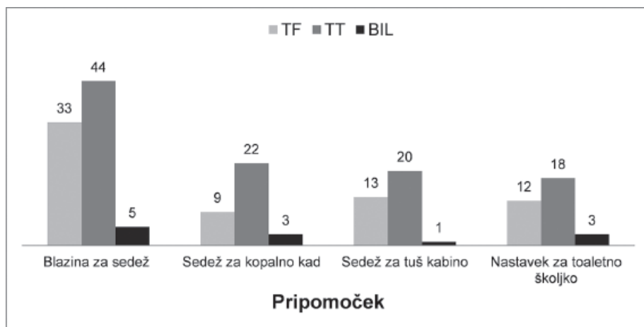
Slika 1: Predpisani medicinsko tehnični pripomočki.