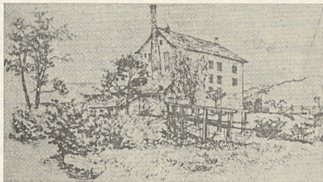
Joštov mlin v Medlogu pri Celju, kjer je leta 1939 druga konferenca KPS