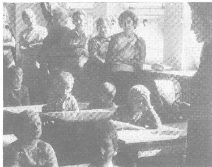
Prvič v šoli! Doživetja številnih malčkov so nepopisna. Eno izmed njih je ujelo fotoreporterjevo oko!