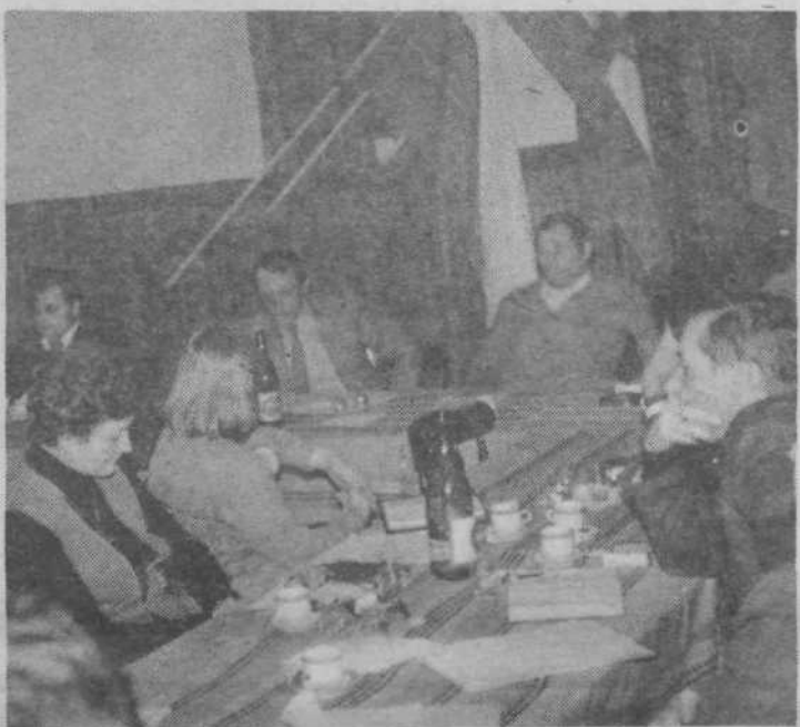
S problemske konference v Žitu

Temeljna izhodišča in akcijski program bodo v ŽK Žito izdelali na osnovi gradiva in razprav s te problemske konference. Osnovne organizacije ZK, sindikat, mladina, individualni poslovni organi in vsi delavci Živilskega kombinata Žito pa bodo