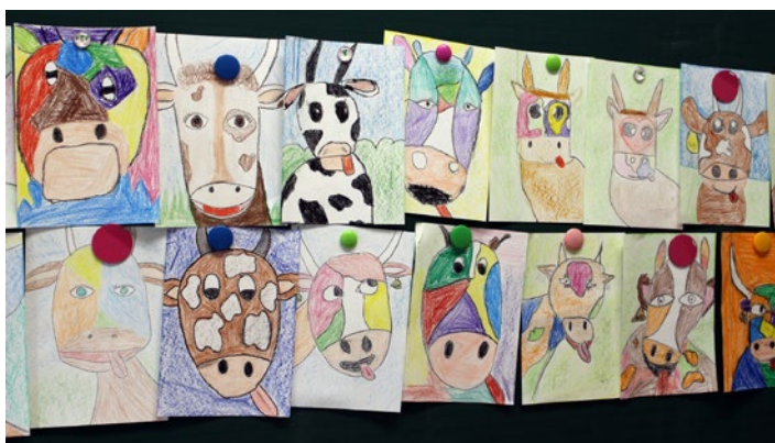
Nastale so tudi čudovite kravice

V petek, 18. novembra, smo ponovno tradicionalno obeležili vseslovenski tradicionalni slovenski zajtrk. Najprej smo pozajtrkovali, nato pa prisluhnili radijski oddaji, v kateri smo se seznanili s pomenom zajtrka. Letošnje leto je bilo v ospredju mleko, za dober začetek dneva. Sledile so različne delavnice, kot so: tehnična delavnica, delavnica izdelave zdravih napitkov, delavnica mlečne poezije in mlečnih rebusov, delavnica mlečne matematike itd. Imeli smo se res »mlekastično«!