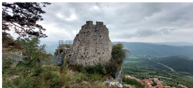
Planincem PD Cirkulane je po obisku Kraškega roba ostal spomin na obmorsko rastje, kamenje, morje in skale.