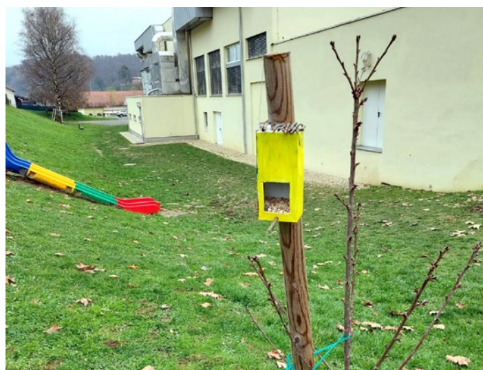
Tudi ptički ne bodo več lačni.