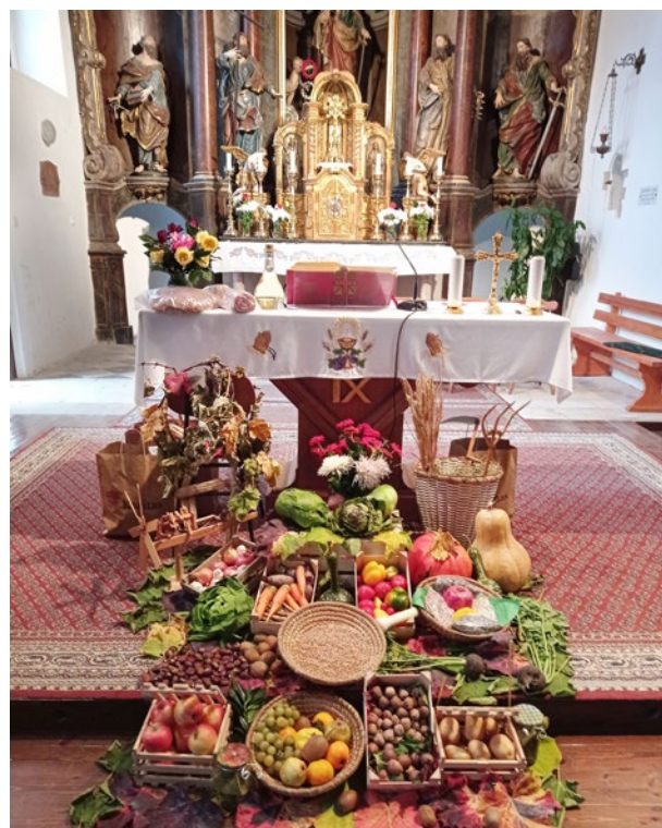
Zahvalna nedelja v cerkvi sv. Barbare.