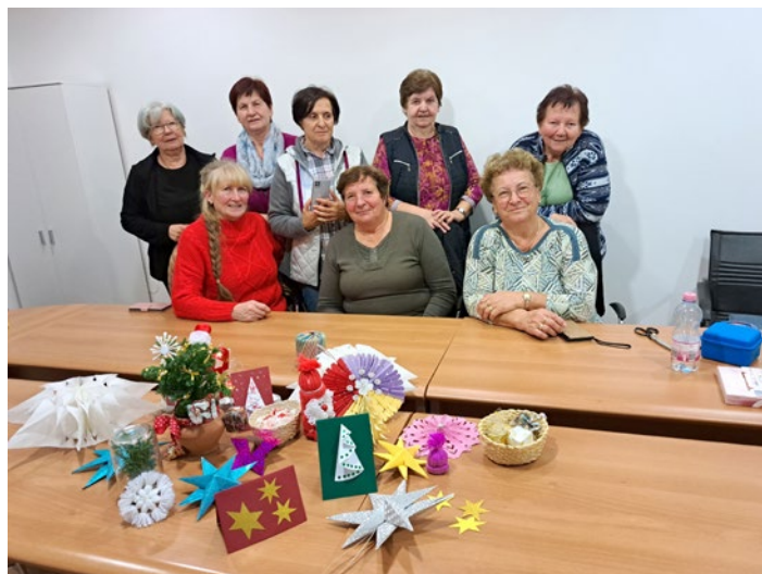
Članice v delavnici, kjer so nastali čudoviti božično-novoletni okraski.

krompirjeve svaljke, krompirjevo pogačo, krompirjev kroppec, krompirjev zos, pražen krompir, krompirjevo solato, za otroke pa krompirjev čips in pomfrit. Na obrazih otrok iz vrtca in šole je bilo videti zadovoljstvo ob pokušanju vseh teh jedi.