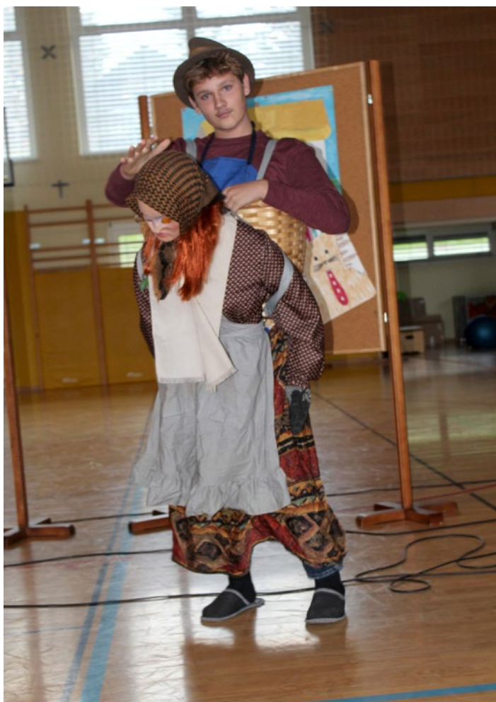
Etnološki lik baba nosi je pomemben del kulturne dediščine.