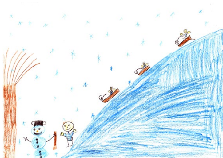
Lovro Tolič, 3. a