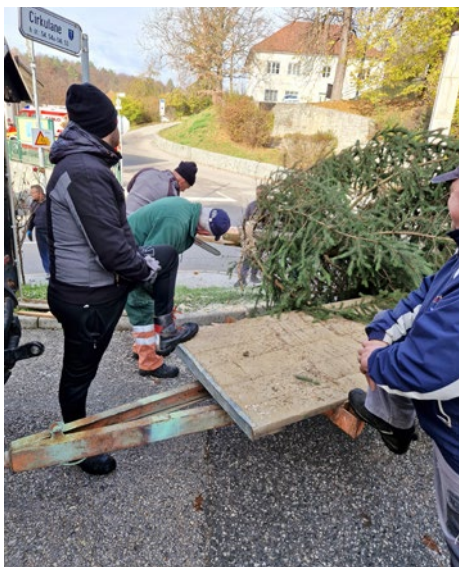
Poskrbeli smo tudi za novoletno jelko.

Kljub obilici dela in obveznosti pa smo gasilci tudi letos v predprazničnem času obiskali svoje občane na domu, kjer smo jim izročili naše gasilske koledarje. Iskrena hvala za vsak podarjeni evro, ki nam bo omogočil nakup modernejše gasilske opreme.