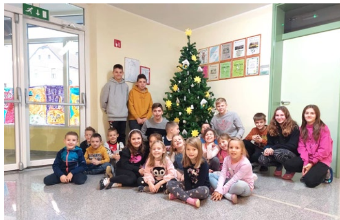
Pričarali smo si čarobni december.