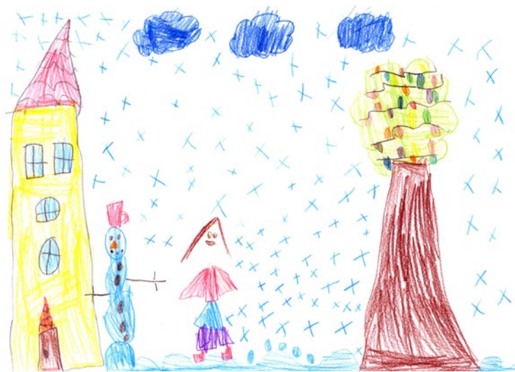
Vita Milošič, 1. a