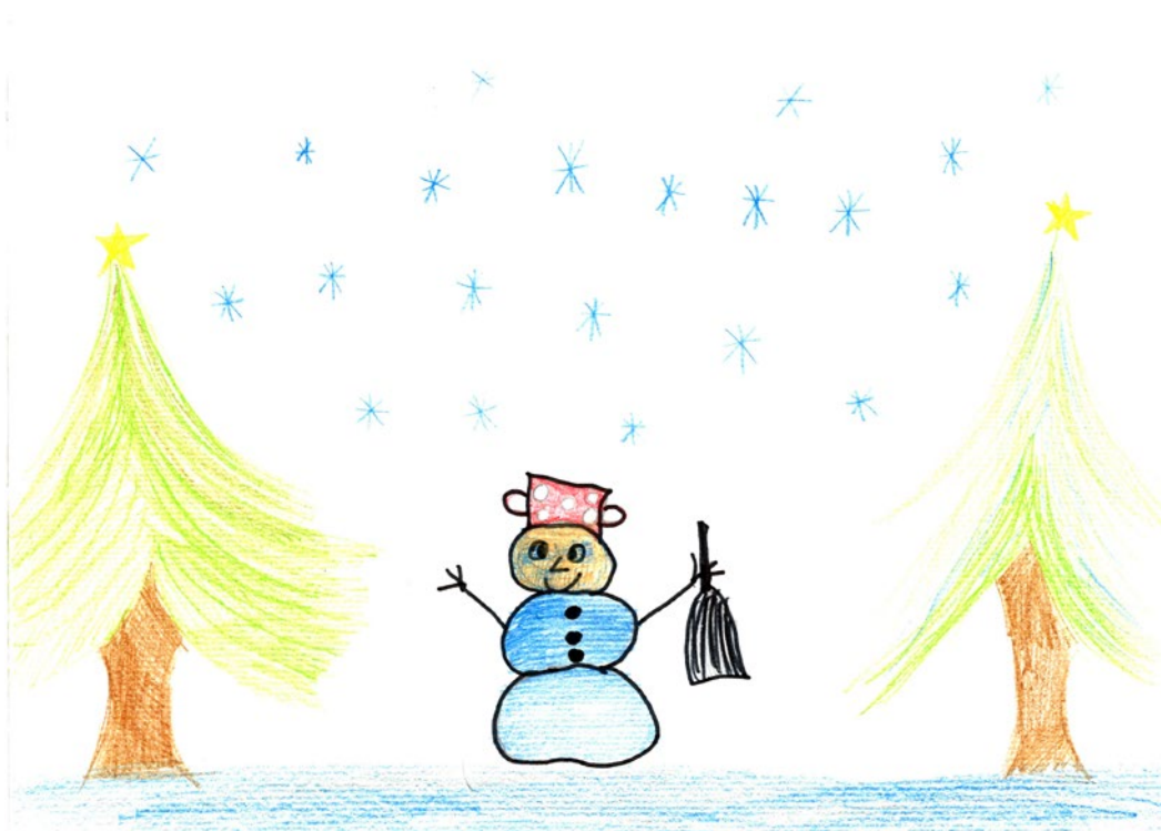
Zoja Obrul, 3. a

Učenci od 6. do 9. razreda z učitelji zgodovine in DKE