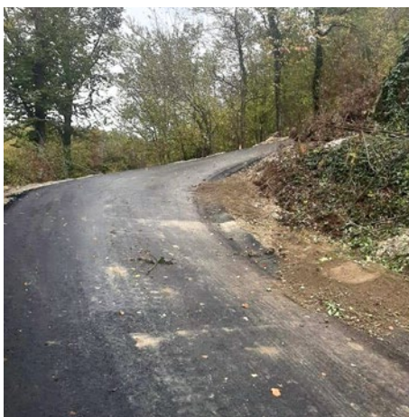
Asfaltiran je zelo strm cestni odsek v Malem Okiču, proti domačiji Fuks, v dolžini 150 metrov, ki bo jim zdaj nekaterim močno skrajšal pot do doma.

Uspelo nam je asfaltirati zelo strm cestni odsek v Malem Okiču, proti do-