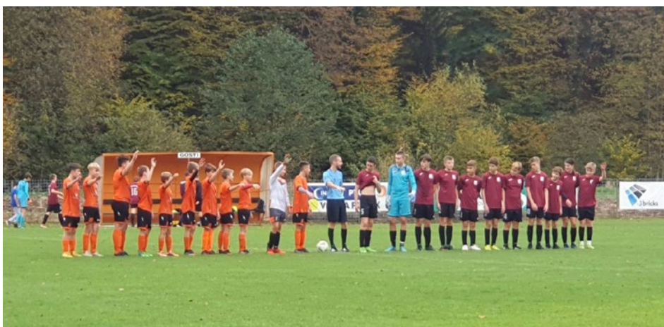
Mlajši dečki, selekcija U15, uspešno nastopa.