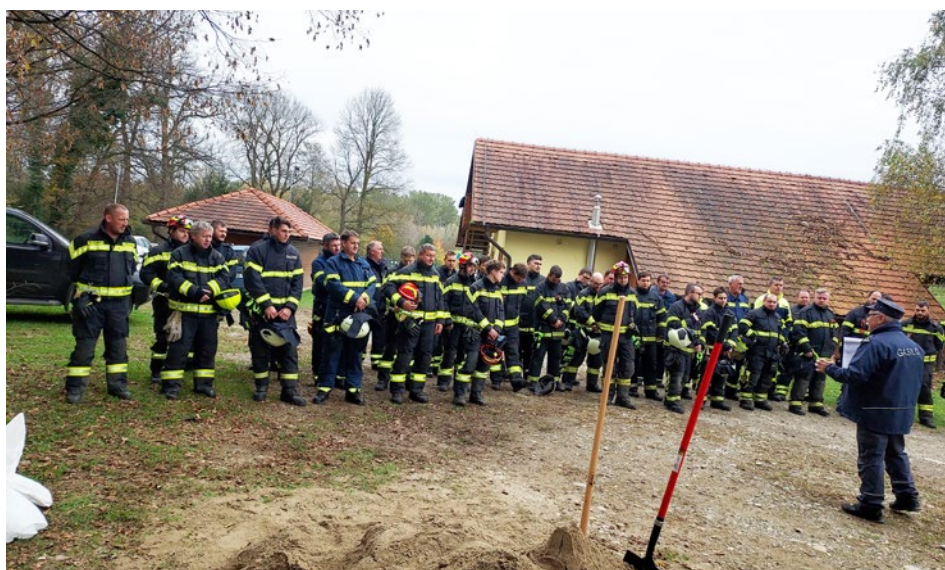
Cirkulanski gasilci na jesenskem preverjanju

V mesecu novembru smo se operativni člani udeležili jesenskega pregleda društev. Na pregledu je sodelovalo deset članov z dvema voziloma: GVC 16/25 in GVM. Tokrat je pregled potekal na treh točkah: v Dražencih, gasilskem domu Ptuj ter športnem parku Zabovci, kjer smo gasili travniški požar, izvedli reševanje ob prometnih