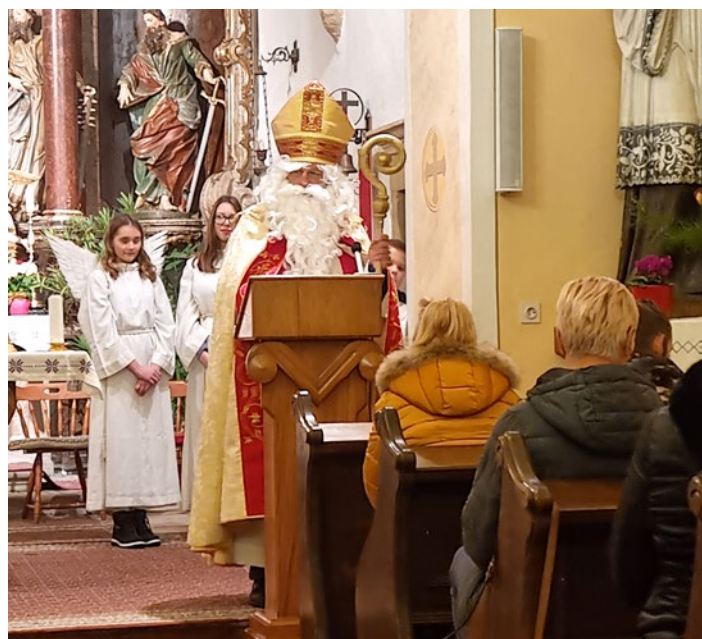
Sv. Miklavž na obisku v cerkvi sv. Barbare v Cirkulanah, kjer je nagovoril in obdaril vse pridne otroke.

In ko je nekaj čez peto v spremstvu angelov v cerkev končno vstopil sveti Miklavž, je med množico završalo. Seveda je Miklavž najprej preveril, kako je bilo kaj s pridnostjo otrok v minulem letu. Če je sklepati po tem, da sta se parkeljna držala bolj v ozadju, v naši župniji prevladujejo pridni otroci. Potem ko so obnovili znanje o farni zavetnici sveti Barbari ter ponovili osnovne molitve, je Miklavževa pomočnica odprla bukve in začela klicati pridne otroke, da pridejo po zaslužena darila. Po zaključku obdarovanja prijavljenih otrok je Miklavž obdaril še svoje zveste pomočnike – angele –, medtem ko sta parkeljna letos ostala praznih rok. Imata pa leto dni časa, da se poboljšata in se