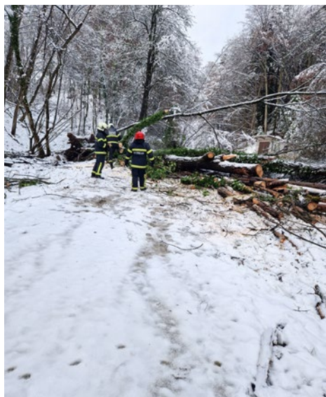
Na decembrski intervenciji so gasilci odstranjevali podrta drevesa.