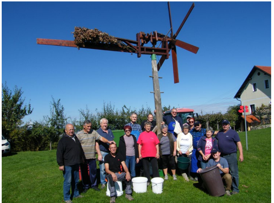
Trgatev v društvenem vinogradu pri sv. Ani

Kot vsako leto smo tudi letos opravili trgatve potomke najstarejše trte na svetu. Naša trta ni v dobrem stanju, saj jo je napadla glivična okužba, tako imenovana ESCA. Pri tej bolezni gre za trohnenje stebela in posledično trta hira. Tudi v drugih vinogradih po Halozah je te bolezni veliko. Zaradi suše, ki je velik šok za trto, so se bolezenski znaki letos kazali precej izraziteje kot običajno. Še večji problem, kot je ESCA, je pojav zlate trsne rumenice, ki je virusna bolezen in se zelo hitro širi. Za okužene trte več ni rešitve in jih je treba iz vinograda takoj odstraniti. Širjenje lahko delno upočasnimo z zatiranjem ameriškega škržatka v