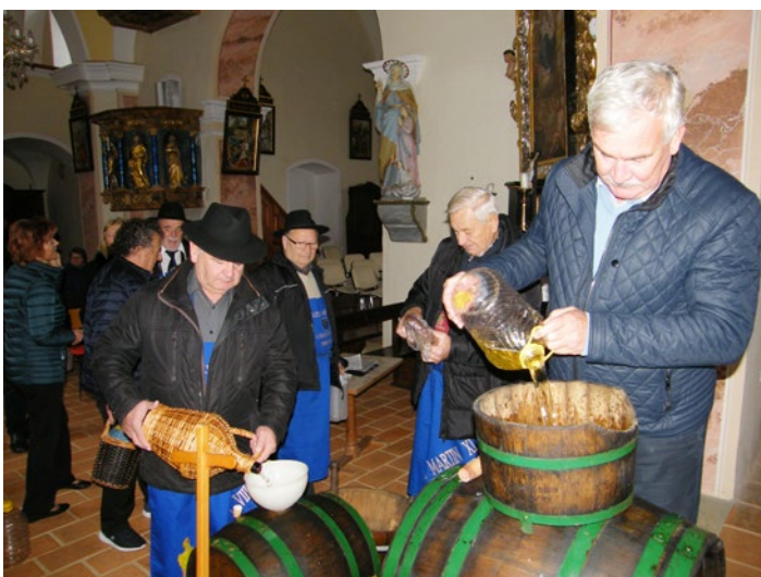
Zbiranje mladega vina