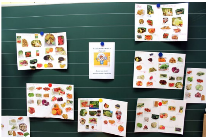
Drugošolci na lovu za recepti