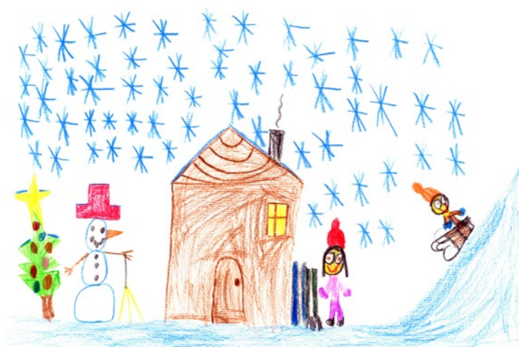
Luka Kobe, 3. a