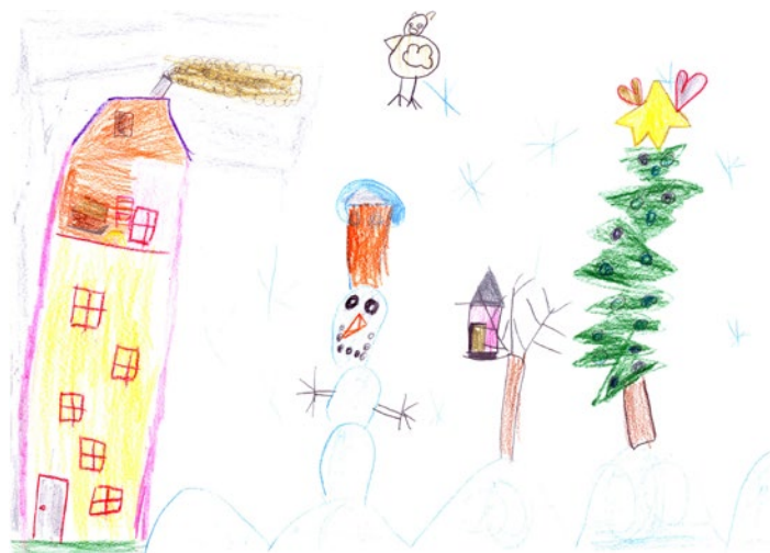
Eva Celcar, 1. a