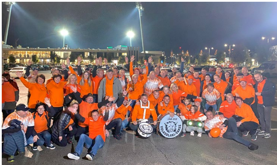
Zvesti navijači ŠD Cirkulane.