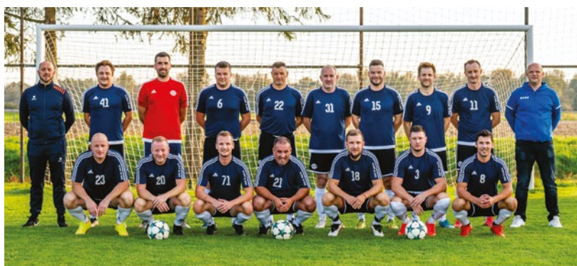
Veteranska ekipa.

Premagali smo vse klube, ki so naši tekmeci v lokalnih derbijih 3. SNL vzhod. Proti ekipi Vidma smo slavili z 1 : 0, Dravi Ptuj 2 : 1, Podvincem 1 : 2 in proti Zavrču 1 : 0. Posebej smo ponosni na tekmo proti Zavrču, saj je bila to daleč najbolj obiskana tekma celotnega jesenskega dela prvenstva, tekmo si je ogledalo blizu 400 gledalcev, na koncu pa smo se zmage veselili »Vareščani«.