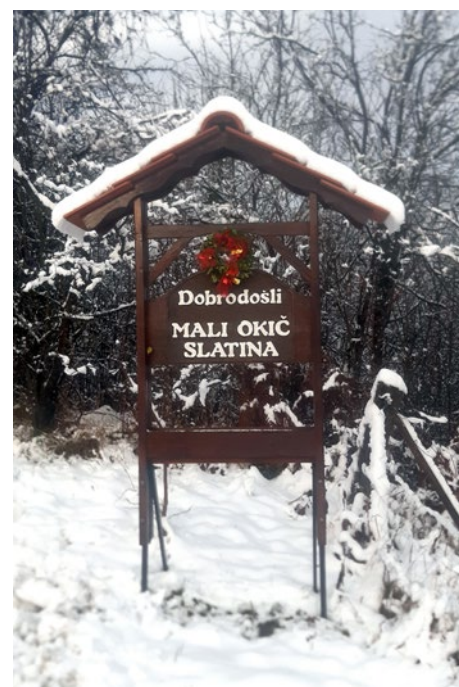
Narava se je odela v zimsko preobleko ...