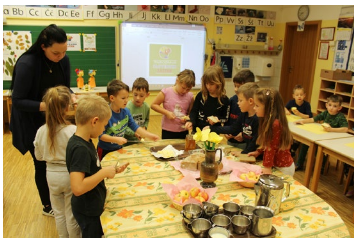
Zajtrk je pomemben za začetek dneva.