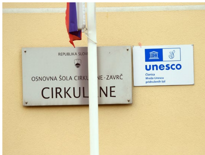
Unesco emblem na cirkulanski šoli.