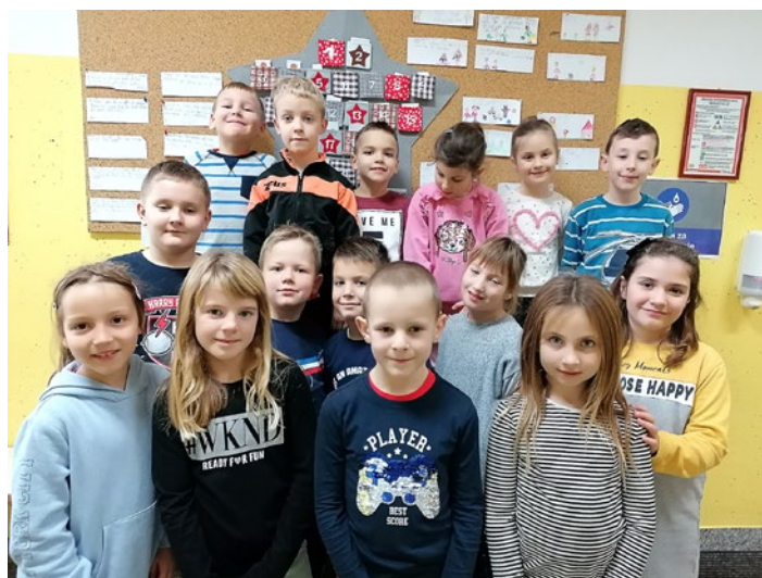
Drugošolci ob adventnem koledarju.

Hvaležna sem sošolki Kaji, da mi vedno stoji ob strani in mi