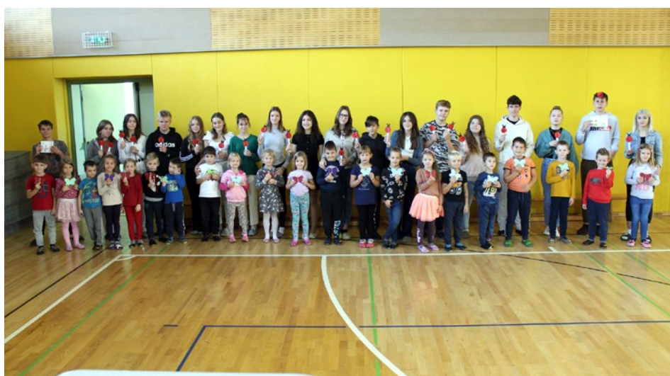
Mali in veliki prijatelji si zmeraj pomagajo.

Devetošolci so našim najmlajšim tako predstavili zaobljubo, oni pa so jo