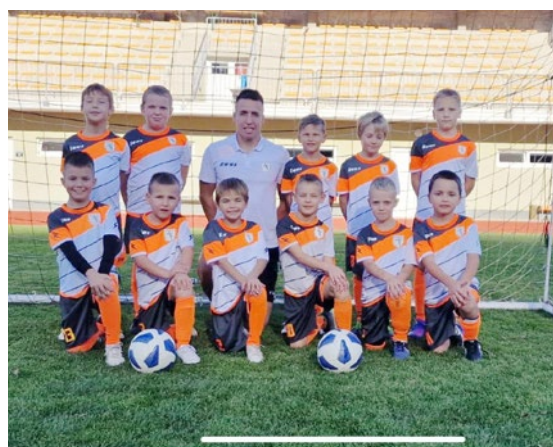
Še ena uspešna ekipa med mlajšimi selekcijami. Na fotografiji fantje U9.