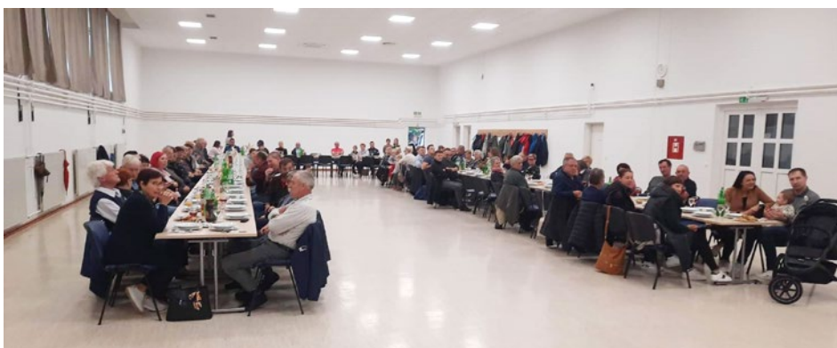
Krajanji Malega Okiča in Slatina na prvem skupnem srečanju.

V mesecu novembru je postal naš kraj še lepši v nočnem času, saj ga krasijo solarne luči, ki smo jih name-