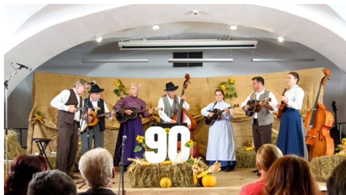
Tamburaši iz Cirkulan na koncertu v Rogatcu