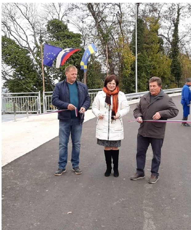
Slovesnost ob zaključku del v Gradiščah