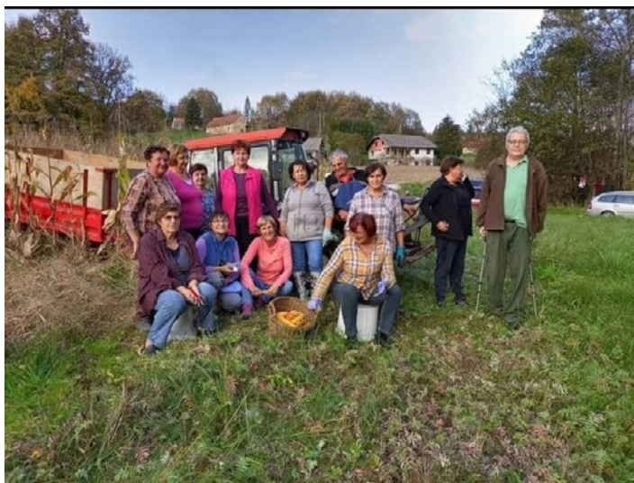
Trganje koruze na društveni njivi

Ž e 1. oktobra smo sodelovali s Turističnim društvom Cirkulane v Parku kulturne dediščine Cirkulane pri ličkanju – kožuhanju – koruze in pri pripravi krompirjevega kropca. Nato smo 14. oktobra sodelovali pri projektu Osnovne šole Cirkulane, kjer sta potekali izdelava in peka žemljic. Potrgali smo skromen pridelek koruze in ga podarili Lovski družini Cirkulane za krmljenje divjadi.