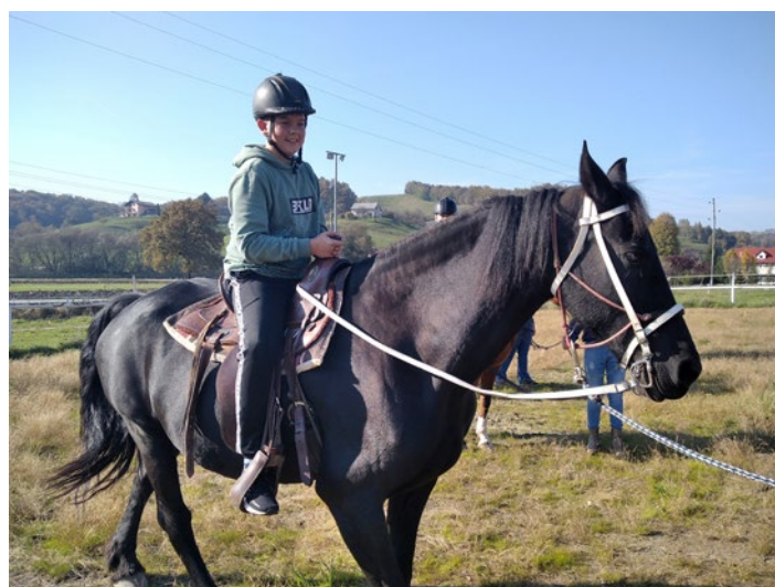
Športni popoldan in jahanje

V okviru izbirnega predmeta Šport za sprostitev na naši