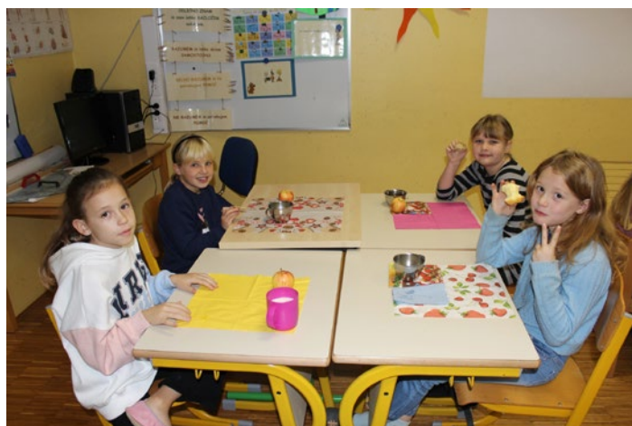
Za okusen zajtrk si zmeraj pripravimo pogrinjek.