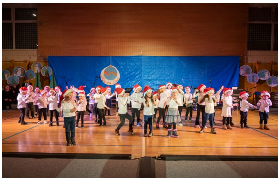
Na odru ni manjkalo božičnih, zimskih in poskočnih korakov, zvena čudovitih pesmi, prav tako ne smeha ter strumnih korakov naših folkloristov ...

Otroci in učenci iz Zavrča in Cirkulan smo se ponovno združili in skupaj ustvarili čarobno pravljico. Medse smo povabili tudi goste, ki so bili del našega programa in se jim resnično iz srca zahvaljujemo, da so se odzvali našemu povabilu. Srčna hvala, ker ste