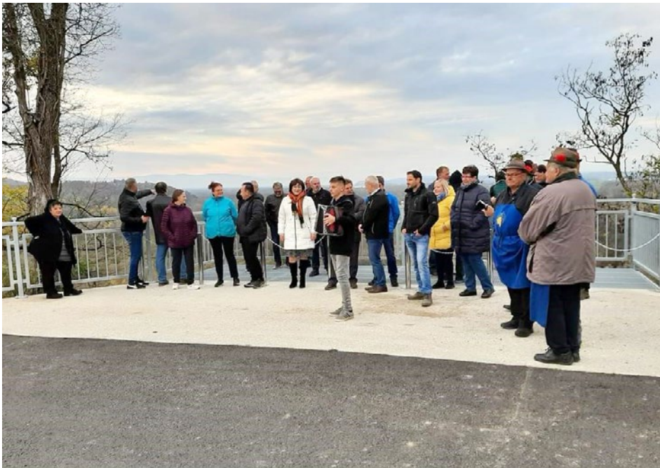
Na otvoritveni slovesnosti po zaključeni sanaciji plazu v Gradiščah in drugih delih v okviru projekta

Celotna vrednost projekta je 689.097 EUR, od tega smo prejeli sofinancer-ska sredstva MOP-a v višini 465.708 EUR.