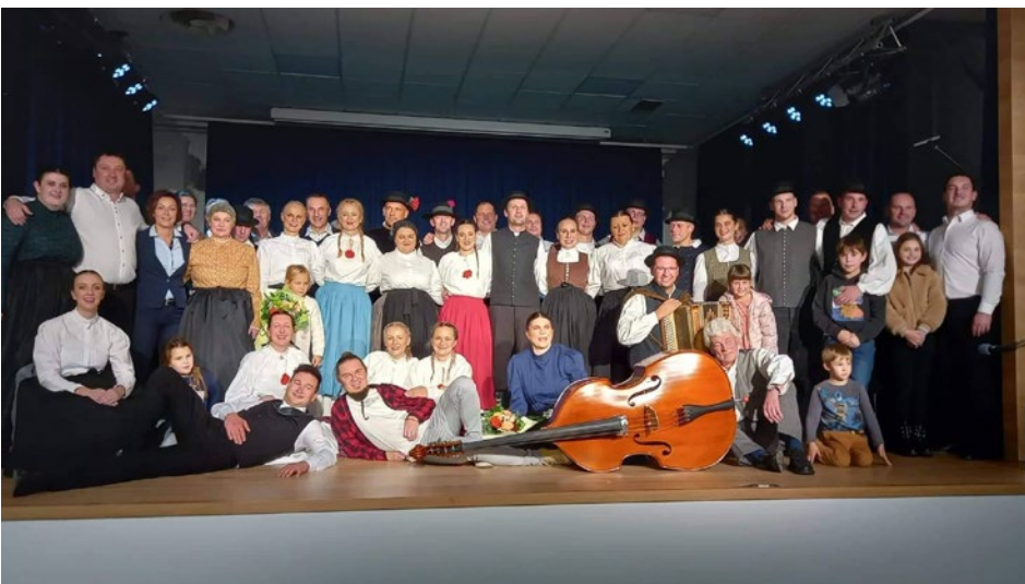
Vsi nastopajoči na cirkulanskem odru.