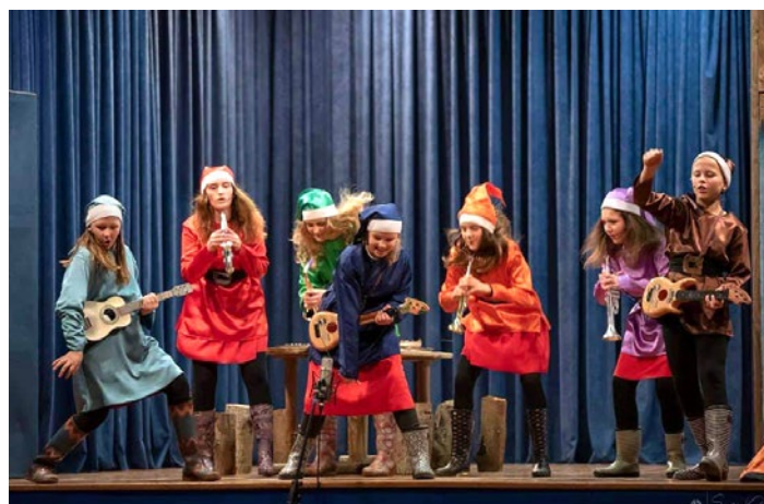
Utrinek s predstave mladih gledališčnikov decembra 2019