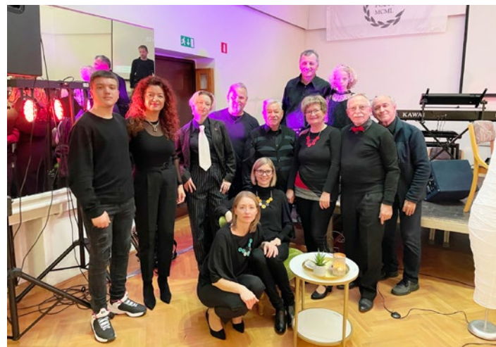
V Narodnem domu na Ptuju na koncertu zasedbe Amos.