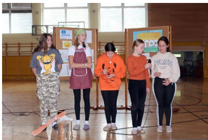
Učenci so spregovorili v različnih evropskih jezikih.