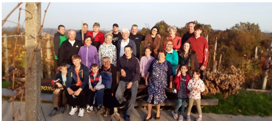
V VO Mali Okič-Slatina so pospravili klopotec.