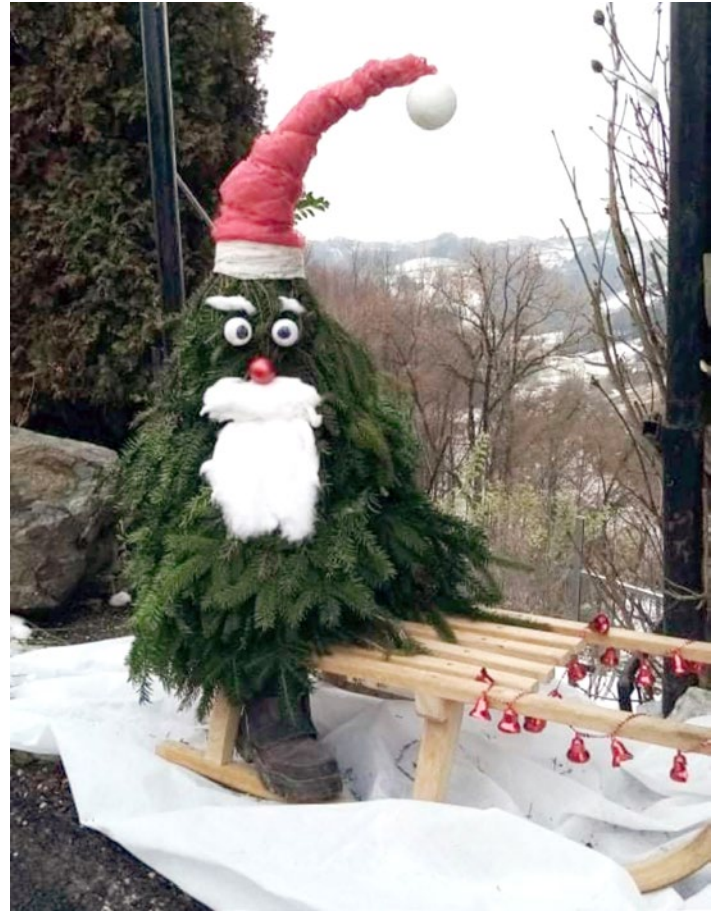
Utrinek iz Gruškovca

Želela bi se zahvaliti vsem, ki smo ta leta družno in konstruktivno sodelovali, družini, prijateljem, sosedom, odbornikom, svetnikoma, županji ter občini, vsem, ki smo izmenjevali mnenja, ideje in se trudili, da naš Gruškovec postane in ostane skupnost, zaradi katere so tudi drugi dobili navdih in motivacijo. In verjemite, marsikdo nam je