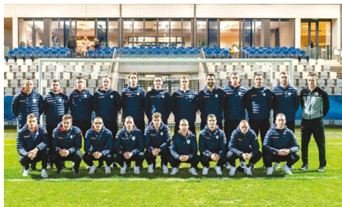
Člani ŠD Cirkulane

Za nami je prva »normalna« polsezona po težkih koron-skih časih, ki so za določen čas ustavili in ohromili tudi do-gajanje na nogometnih zelenicah. Med njimi tudi v ligi, kjer nastopamo veterani. Ta jesen pa se je začela popolnoma nogometno, brez omejitev in z vsemi spremljevalci nogo-