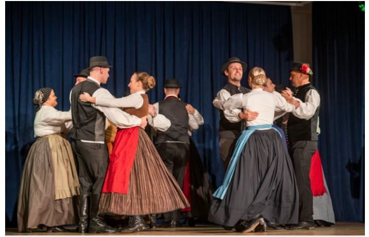
Plesni pari so se vrteli na koncertu Midva.