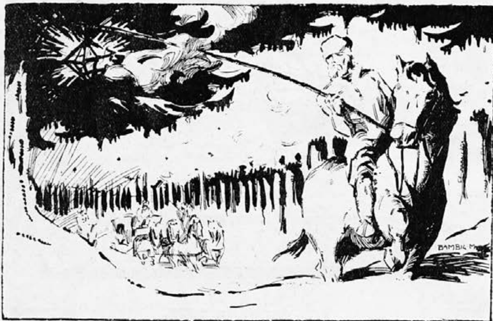
Henrik Sienkiewicz :