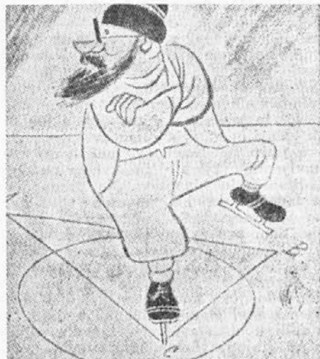
Kdo je to?

Navpično: 1. matematik, 2. igo, 3. sak, 4. Ida, 5. Jeruzalem, 6. oda, 7. Nil, 8. Ala, 9. rokominec, 17. Man, 18. ata, 19. čuk, 20. dan, 21. Olt, 22. Ter, 28. oko, 29. pot, 30. Abo, 31. oče, 32. dur, 33. ime.