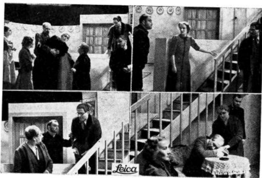
● Iz lanske dramske sezone: Štirje prizori iz Brunčičeve drame: »MED ŠTIRIMI STENAMI«. (Summar F = 5 cm 1 : 2 — Perutzov Peronnia film.)