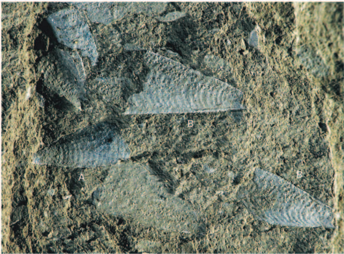
TABLA 1 – PLATE 1