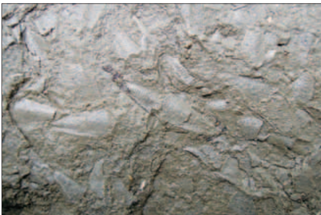
Sl. 4. Pteropodi vrste Clio pedemontana (Mayer, 1868) v badenijskih laporovcih s Poličkega Vrh. Velikost slikane površine 65 x 40 mm

Opis pteropodnih ostankov: Hišice opisane oblike so podolgovato-trikotne do stožčaste oblike (sl. 4; tab. 1). Bočno precej stisnjene oziroma ozke z izbočenimi ali konveksnimi osrednjimi deli, z zašiljenimi vrhovi, širokimi do ozko ovalnimi ustji. Od vrha proti ustju poteka večje število prečnih in konveksnih reber, tako da je površina rebrasta. Število prečnih reber pri naših poškodovanih primerkih se giblje med 17 in 20, pri v celoti ohranjenih primerkih bi jih moralo biti okrog 25. Na straneh hišice sta ozka in ostra sploščena robova hišice, ki od vrha proti ustju divergirata pod različnimi koti, od 22° do 26°.