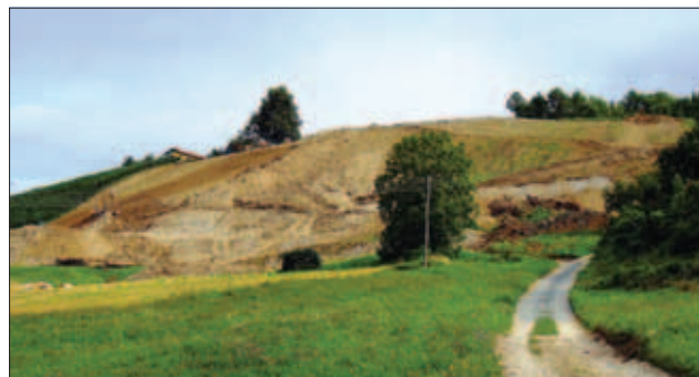
Sl. 2. Srednjemiocenski laporovci na pobočju Poličkega Vrha

Nahajališče: Pri zemeljskih delih celovite obnove vinograda na Poličkem Vrhu ob regionalni cesti Jareninski dol – Šentilj v Slovenskih goricah (sl. 2) so poleti 2011 odprli več profilov na 100 m dolgem pobočju Poličkega Vrha. Kamnine v nahajališču so bile večkrat pregledovane v avgustu in septembru 2011. Ko so se gradbena dela v vinogradu tudi končala, so bili vsi profili zravnani v velik vinograd.