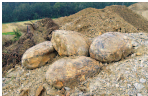
Sl. 3. Septarijske konkrecije s Poličkega Vrha

V spodnjem delu profila so laporovci drobno plastnati in mehki, z več terigene komponente in večjo vsebnostjo sljude. Med laporovci se mestoma pojavljajo do 40 cm debele leče peščenega slabo sprijetega laporovca s številnimi ostanki pteropodov. V zgornjih 40 m profila so laporovci masivnejši in bolj litificirani z več karbonatne in manj terigene komponente. V tem delu profila so bile najdene tudi pogostne kroglaste septarijske konkrecije s premerom do 1,5 m in valjaste konkrecije s premerom do 2,5 m (sl. 3). V konkre-