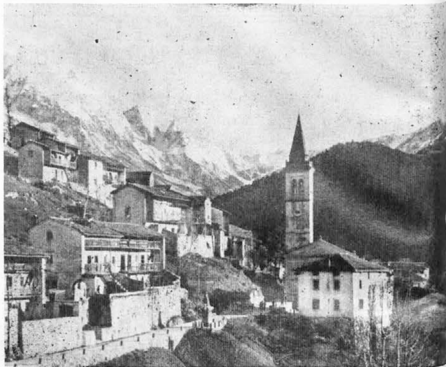
Stolbica ob vzhodju Skupine Kanina

V kratkem bodo odprli pri postaji žičnice, ki vozi na Višarje, velik in moderen hotel, ki bo imel tudi kopalniški bazen in igrišče za tenis. V tej bližini so tudi že vzpostavili ski-lift. Vse te udobnosti bodo brez dvoma letošnje zimo pritegnile v Ovčjo ves, oziroma na Višarje, saj se pride tja z žičnico že v 6 minutah in kjer je poleg krasnih smučišč in dobro opremljenega novega hotela, ki je bil odprt lani decembra meseca, še več ljubiteljev zimskega športa.