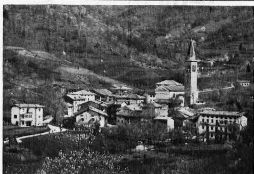
TAIPANA è un grazioso capoluogo circondato da ridenti colline. Al centro spicca superbo lo snello campanile. La sua popolazione, che sa gli affanni e le durezze della vita, confida in giorni migliori, più tranquilli e sereni.