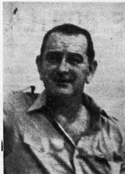
LYNDON JOHNSON novi predsednik U.S.A.

Kennedyja (35. predsednika USA in najmlajšega od vseh in tudi prvega izvoljenega katoliškega kandidata) je takoj nadomestil, kot to predvideva ustava Združenih držav, podpredsednik Lyndon Johnson, rojen dne 27. avgusta 1908 v Johnson City y Texasu.