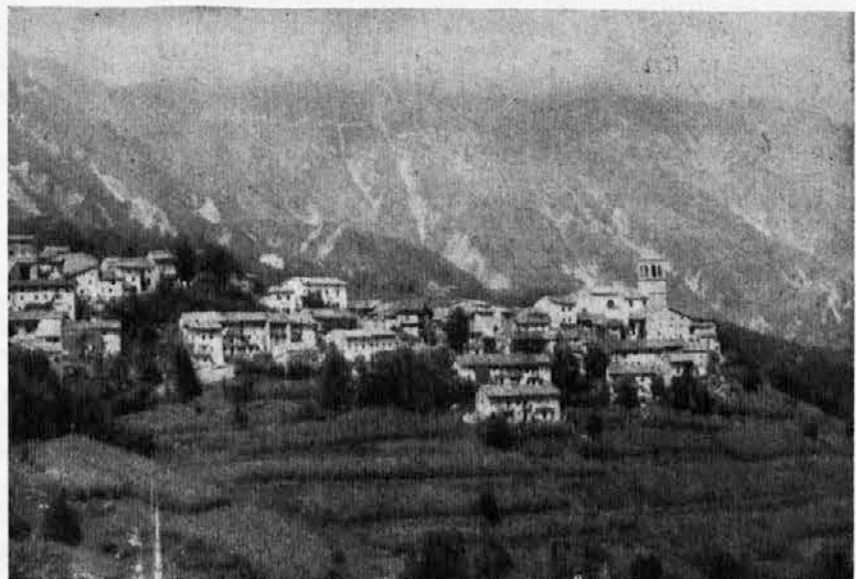
MONTEAGGIORE è sito alle falde della catena del Gran Monte. E' una delle zone più abbandonate e depresse. La sua popolazione è stata dimezzata dal fenomeno emigratorio dovuto alla mancanza di fonti di lavoro e buona volontà.