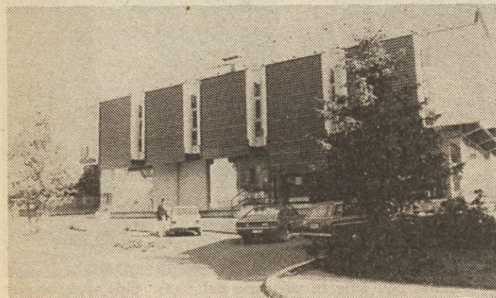
Dolenjka v Trebnjem

Ljutomer, 4. januarja – Delavci DO Emona Commerce so slavili še eno delovno zmago. Ob skromni slovesnosti so za železniško tovorno postajo v Ljutomeru položili temeljno ploščo za nov proizvodno-predelovalni obrat in zasadili prvo lopato.