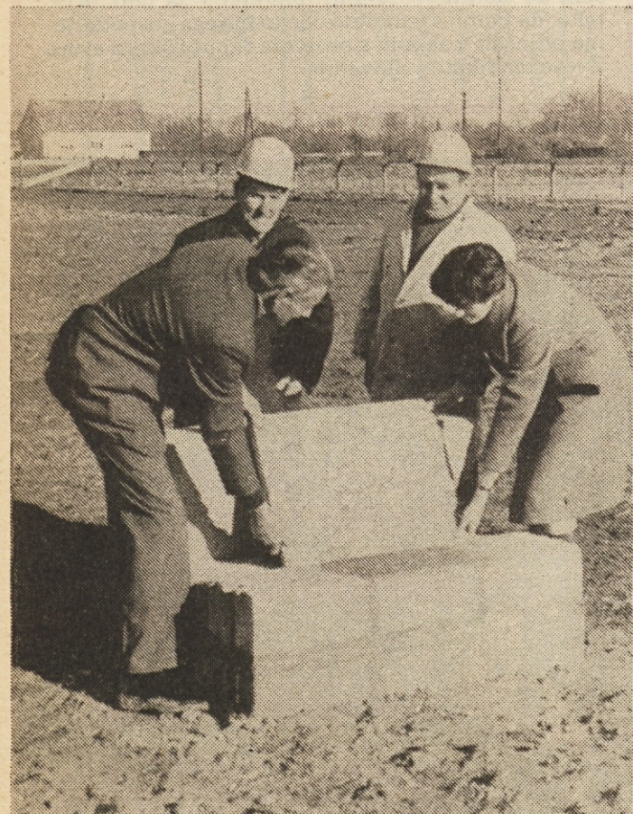
Nova moderna predelovalnica v Ljutomeru