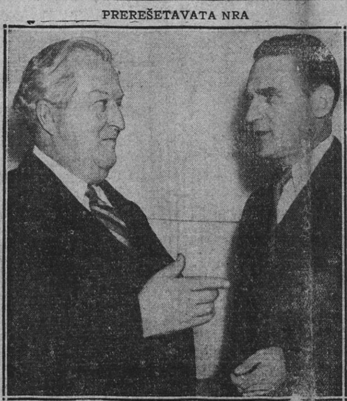
Senator McCarren iz Nevade (na levi) v pogovoru s senatorjem Geraldom P. Nye iz No. Dakote. Oba senatorja sta vložila skupen predlog, da senatska zbornica temeljito prouči in preišče dosedanje delovanje NRA in je koderke.

Z nominacijo za kandidata za kontestne volitve sedanje kampanje je potreba poslati novega naročnika!